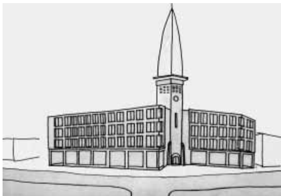
Het nieuwste plan voor de Zuiderkerk.