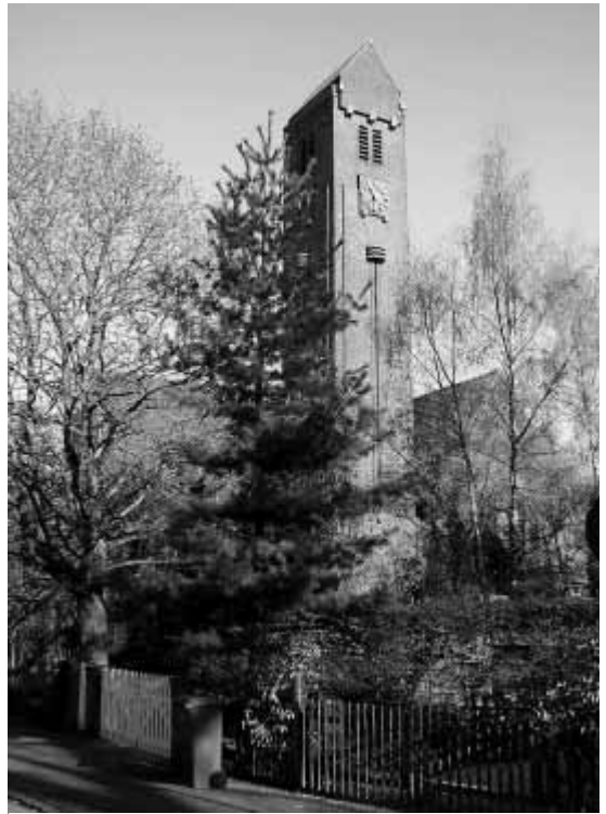
De Tesselshadekerkerk.

slotte heeft de Hilversumse monumentencommissie in het verleden positief geadviseerd over plaatsing op de rijkslijst. Colleges en gemeenteraad hebben toen op economische gronden anders beslist. Mocht de gemeente het verzoek 'onverhoopt' tóch afwijzen, dan moet dat wel met redenen omkleed worden, stelt Dubbelaar. Waarna het genootschap weer de gelegenheid heeft om naar de gemeentelijke commissie voor bezwaar- en beroepschriften te stappen. En vervolgens – bij nul op 't rekest – de gang naar de rechter te maken. Dat de plannen voor het terrein nu al jaren stilliggen, is volgens Dubbelaar niet de schuld van zijn genootschap, maar van de gemeente. De gemeente heeft in het verleden gewoon haar werk niet gedaan, stelt hij. Wij beschouwen de Zuiderkerk als een ankerpunt in Hilversum-Zuid en zullen er alles aan doen om hem te behouden. Het laatste nieuws is, dat de gemeente waarschijnlijk kiest voor behoud van de toren in combinatie met de bouw van een aantal appartementen, een ondergrondse supermarkt en een parkeergarage.