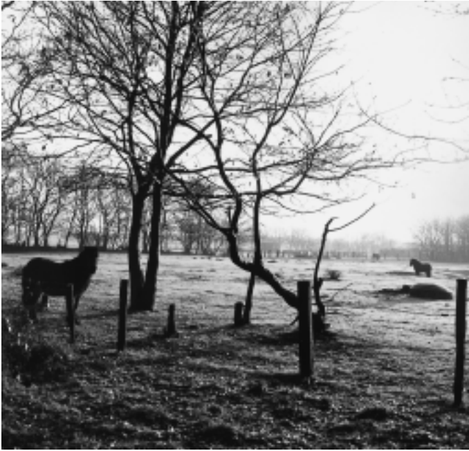
Een blik op Kerkelanden vanaf de Raaweg eind 1965, kort voordat de bouw losbarstte. Weiden, bossages en ponies, veel meer zag men er niet.