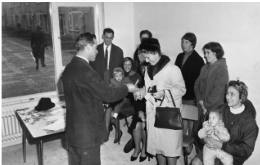
Uitreiking van de eerste sleutels in het voorlichtingscentrum Lutherhof 6, 27 oktober 1967.

het gemeentelijk huisvestingsbureau aan aantal zeer urgente gevallen helpen. Zoals een bejaard echtpaar dat in een onbewoonbaar verklaarde woning aan de Bussumerstraat woonde, maar nu een vrijkomend huis aan de Korenbloemstraat kreeg aangeboden. Enkele kersverse Kerkelanden-bewoners lieten huizen achter die gesloopt moesten worden in het kader van de kernreconstructie. Onder de eerste bewoners bevonden zich ook de gezinnen van onderwijzers en ambtenaren die uit andere gemeenten afkomstig waren. De familie Spijksma, Lutherhof 2, kreeg twee weken later hoog bezoek; oud-mi-