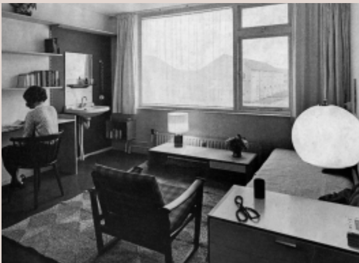
De 'meisjeskamer' op de eerste verdieping van de modelwoning. De kasten zijn beplakt met pakpapier, en de wastafel is opgenomen in een 'bergwand met werkgelegenheid'.