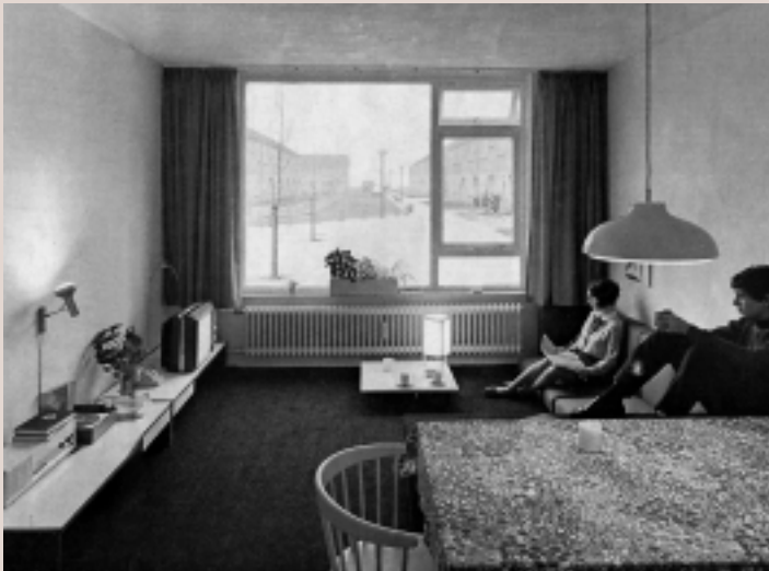
De woonkamer aan de voorzijde met eet-tafel, kussens op de grond (onder meer om tv te kijken), en een lage kast waarop ook gezeten kon worden. (uit: Goed Wonen , 1968)

Op de bovenverdieping heb ik het meisje van 18 jaar de kamer gegeven met de wastafel. Meestal pikken de ouders die kamer voor zichzelf in, ook daarmee ben ik dus tegen de draad in te werk gegaan. In de jongenskamer is het bed niet op de gewone plaats in de hoek gekomen, maar ergens dwars in het midden. Met zo'n modelwoning moet je maar eens laten zien, hoe het ook anders kan.