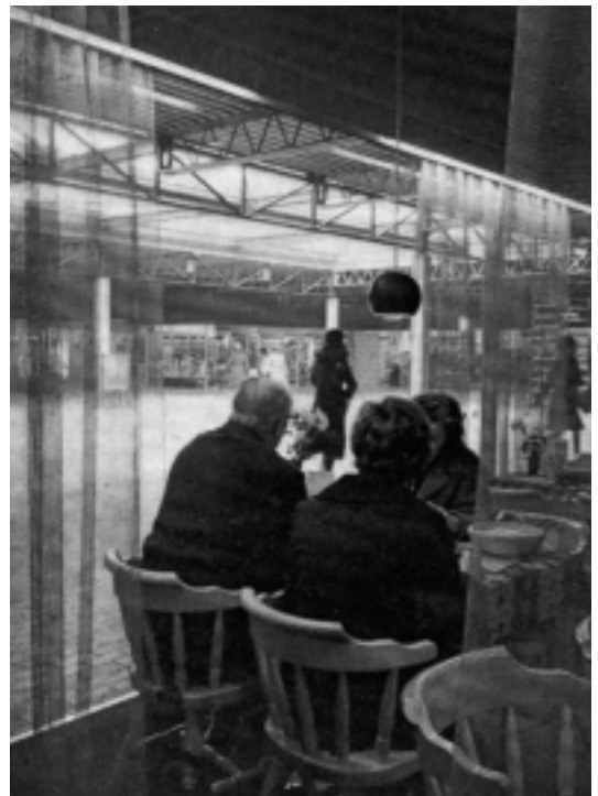
Vanuit coffee-corner Siësta konden (en kunnen) de voorbijgangers op het centrale plein worden bekeken.