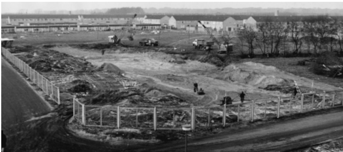
Grondwerkzaamheden ten behoeve van de bouw van het winkelcentrum in december 1970.

bewoners van de Lutherhof, het eerste hofje. Hieruit ontstond het plan om in de nabijheid van waar het winkelcentrum moest verrijzen alvast een aantal eenvoudige noodwinkels – onder meer een supermarkt – te plaatsen. 2