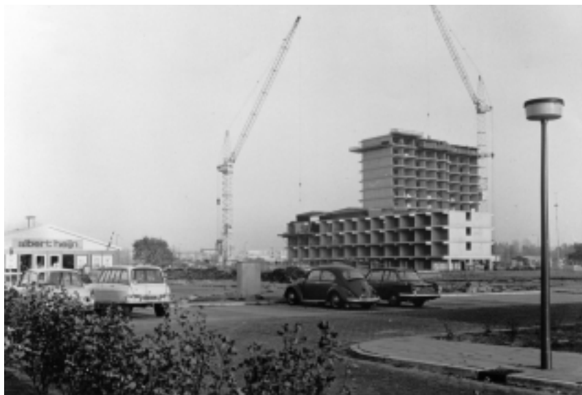
Links op deze foto is nog de in november 1968 geopende noodwinkel van Albert Heijn te zien.

Al in het voorjaar van 1968 bleek dat de huisvrouwen van Kerkelanden behoefte hadden aan een aantal winkels in de wijk. Die wens kwam naar voren tijdens gespreksavonden, die de stichting Hilversumse Gemeenschap op touw zette voor