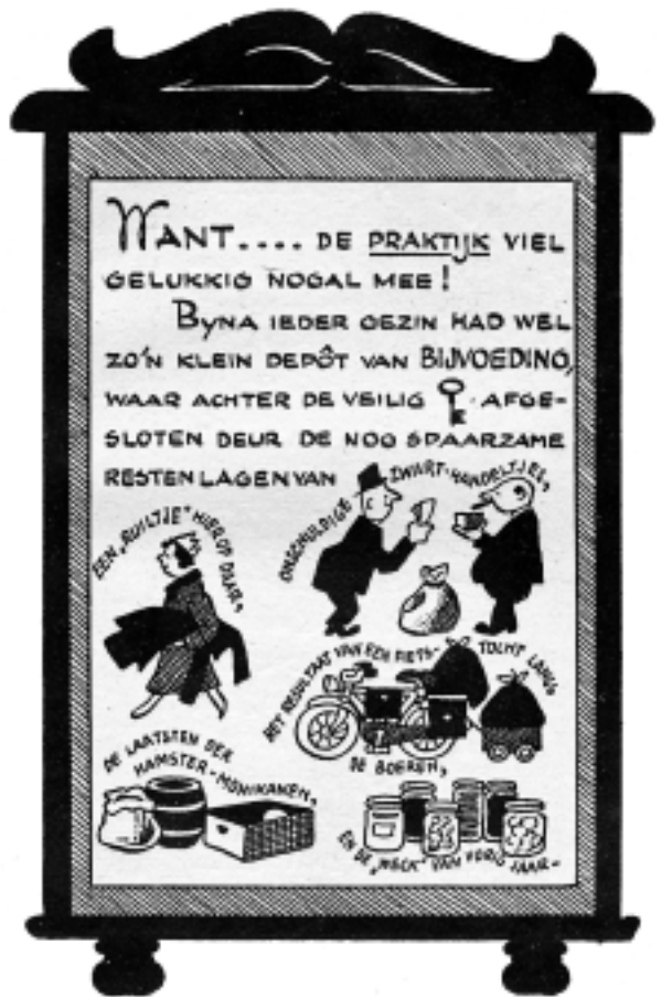
In de praktijk viel het met de honger nog wel mee, althans voor hen die nog wat te ruilen hadden, nog wat voorraad hadden of 'de boer op' konden. Uit: O, dat winterje '45. (coll. auteur)

Door de spoorwegstaking en het daarop volgende verbod van Seyss-Inquart op scheepsvervoer, kwam de aanvoer van voedsel naar het westen van ons land op een erg laag pitje te staan. Wel werd het verbod op scheepsvervoer eind november opgeheven en gingen de schippers zelfs samenwerken in een nationale rederij, maar toch bleven de tekorten oplopen. Niet dat de hoeveelheid beschikbaar voedsel nu zo erg klein was, maar de gemeenten hadden al eerder in 1944 niet meer de mogelijkheid gehad om enige voorraad voedsel op te bouwen. Het probleem zat hem daarnaast in de ongelijke verdeling van het beschikbare voedsel. In de plattelandsgedebieden van bezet Nederland was er nog ruim voldoende eten, maar in de steden niet. En transport was moeilijk geworden: geen trein, geen schepen, vrachtauto's die vanuit de lucht beschoten werd. Vandaar die nationale rederij, om zo via het IJsselmeer toch nog voedsel in de grote steden te krijgen. Totdat eind december het IJsselmeer dichtvroor. Hilversum heeft getracht op allerlei manieren toch