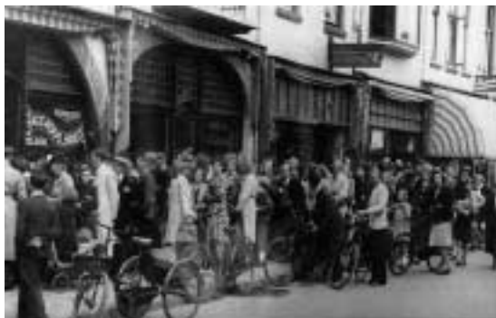
Lange rijen voor enkele winkels met weinig koopwaar, zoals hier in de Havenstraat.

Geen veranderingen in de toestand: harde gevechten in Zeeuws-Vlaanderen en bij Woensdrecht. 's Nachts zien we vaak licht in het zuiden. 't Weer is slecht, barometerstand 747, plensbuien, harde wind. Weer een treinbotsing in de buurt van het station.