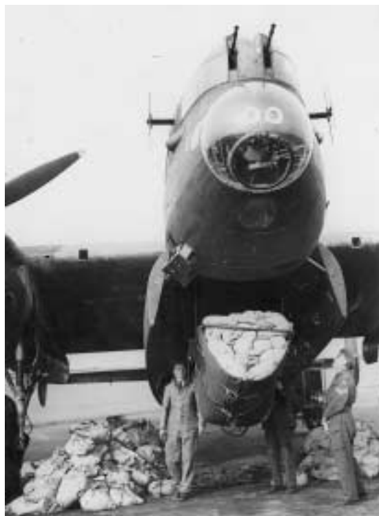
Eind april: Lancasters van de Engelse Royal Air Force worden ingezet om het zo broodnodige voedsel boven de hongergebieden te droppen.

Gisternacht werd Laren opgeschrikt, mannen werd bevolen mee te helpen. De huizen aan de Lage Vuur-