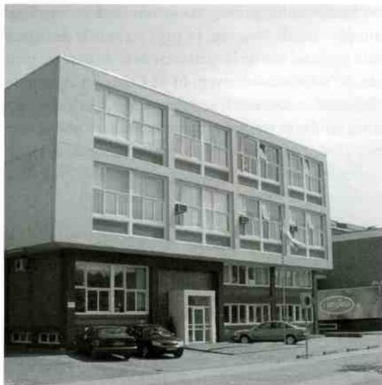
Het kantoorgedeelte van het complex aan de Larenseweg.

De uit de jaren vijftig daterende melkfabriek aan de Larenseweg in Hilversum krijgt wellicht een plek-