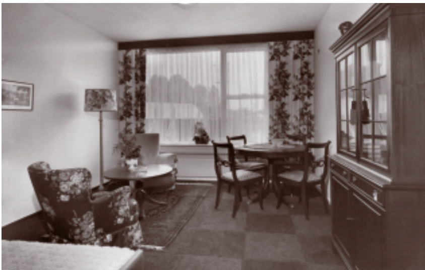
Het interieur van een model- kamer van Flat Kerkelanden in oktober 1969.

Flat Kerkelanden bestaat uit twee bouwblokken. Het eerste bestaat uit zes bouw-lagen. Dit verzorgingshuis biedt onderdak aan 162 alleenstaande bejaarden en achttien echtparen. De wooneenheden hebben een toilet, douche, kookgele- genheid, en een koelkastje. Voor alleenstaanden gaat het om een zitslaapkamer, de echtparen hebben een aparte slaapkamer en woonkamer. Iedere etage heeft