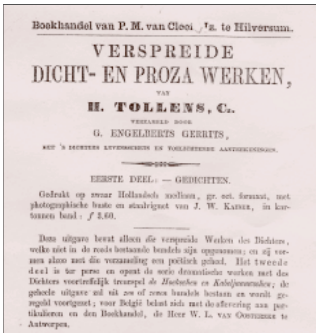
Folder van Van Cleef voor de Verspreide dicht- en prozawerken van Tollens. Archief KVB PPA 558:12.

In de jaren '50 was een nieuwe vinding in opkomst, verlichting door middel van gas. In februari 1857 diende een Amsterdamse neef van mevrouw Van Cleef, Fre-