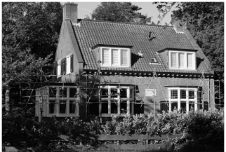
Klein Hartenstein aan de 's-Gravelandseweg 137, gebouwd in 1914.