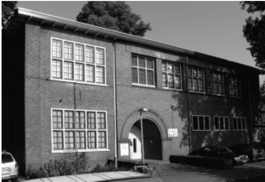
De Trompschool aan de Badhuislaan 10 dateert van 1906.