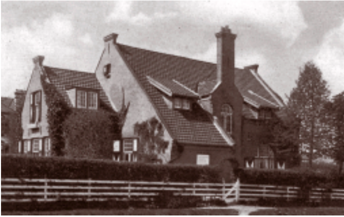
De Veldhoeve uit 1898 aan de Godelindeweg 17, met typerende 'boerderij'-kenmerken.

een hoog pannendak met een fikse overstek, dat vaak voorzien is van een geknikte rand zodat het er uit ziet als een Chinese strooien hoed. De nadruk ligt op de horizontale lijn. Hij bracht zelden versieringen aan óm het versieren, maar liet deze voortkomen uit de constructie. Tussen 1898 (Godelindeweg 17, het eerste huis waarin zijn nieuwe stijl naar voren begint te komen) en 1905 (Beethovenlaan 27) worden de gevels van veel gebouwen voorzien van het bouwjaar in sierankers. Hij liet de buitenluiken meestal standgroen schilderen met een uitgesneden hartje. Deze hartjes zijn ook binnen terug te vinden in de vlakke spijlen van de trappen, die altijd voorzien lijken te zijn van grote ovale knoppen. Het houtwerk van deuren en plafonds liet hij het liefst gelakt of ongeverfd om het hout zelf tot zijn recht te laten komen. Rond de tuin staat een stevig wit geschilderd houten hek.