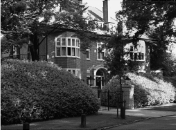
Boschhoek, Palestrinalaan 11, werd gebouwd in 1908.

ontwierp bijvoorbeeld uitbreidingen aan Het Melkhuisje op de Bussumergrintweg. Hij ontwikkelde zich tot een verdienstelijk architect: het huis aan de Beethovenlaan 28 is onder meer van hem. Vanaf 1925 werkte hij samen met zijn vader in een aantal verbouwingen en projecten als het huis aan de Wagnerlaan 30 en ook de Godelindeschool aan de Mozartlaan 6.