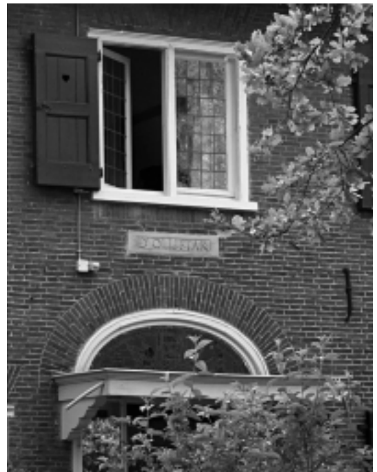
Detail van d'Olijftak: bovenlicht en gevelsteen. De standgroen geschilderde luiken met een hartje zijn typisch voor Hanrath.