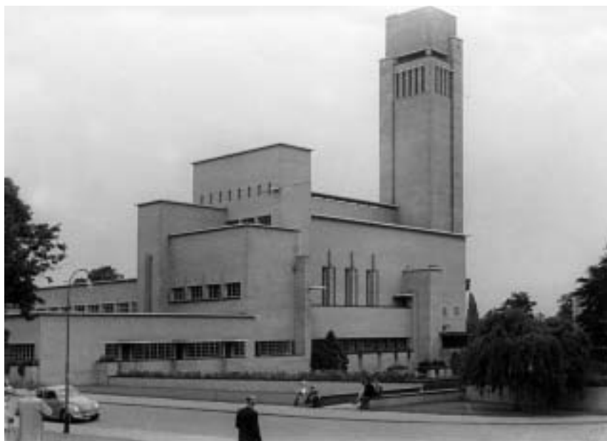
Raadhuis, 12 augustus 1954.

Ik woon nu achttien jaar in Hilversum. Na mijn vervroegde uittreding uit de automatisering ben ik vijf jaar fractieassistent geweest van een gemeentelijke politieke partij en bewoonde die tijd een kamer in het raadhuis van Hilversum. De schoonheid van de buitenkant van dit gebouw had ik als jongen van 16 jaar al ervaren, want tijdens een jeugdherbergvakantie (waaronder in de Karekiet Kortenhoeft) heb ik het raadhuis met mijn boxje al een keertje vastgelegd. De binnen-