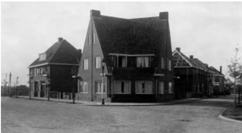
Padangstraat 20, Enschede (22 oktober 1932). (coll. auteur)

In het voorjaar van 2006 deed de archivaris van het Streekarchief Gooi en Vechtstreek een oproep voor een vrijwilliger om aanvullend onderzoek te doen naar genoemde bouwvergunningen. De schrijver van dit artikel heeft zich als enige vrijwilliger voor deze klus aangemeld en is in mei 2006 gestart met de werkzaamheden, die uitsluitend op vrijdag, als het Streekarchief is gesloten, kunnen worden uitgevoerd.