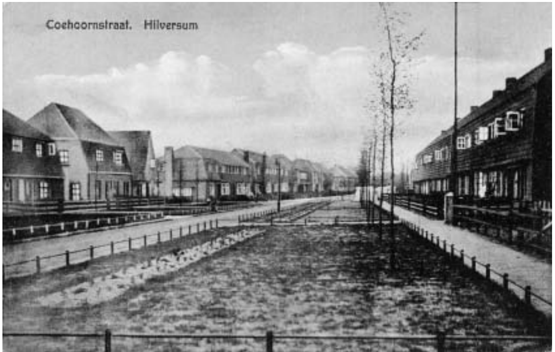
De pas aangelegde Coehoornstraat, omstreeks 1920. Zo'n beetje de nieuwbouw van de jaren twintig. Mooi hè, die brede straat, dat type woningen. Kijk eens hoeveel ruimte er tussen die woningen zit. Er zijn heel weinig kaarten van deze buurt. Wel van de Larenseweg en de Jan van de Heijdenstraat, maar niet van de straatjes ertussen.