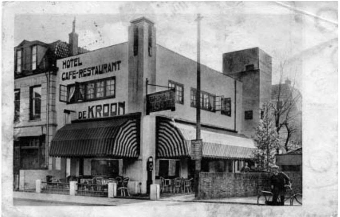
Stationsplein 2a: Hotel-café-restaurant De Kroon. 'Aanbevelend P. Wind. Telefoon 1978'. Deze kaart is in 1930 verstuurd.