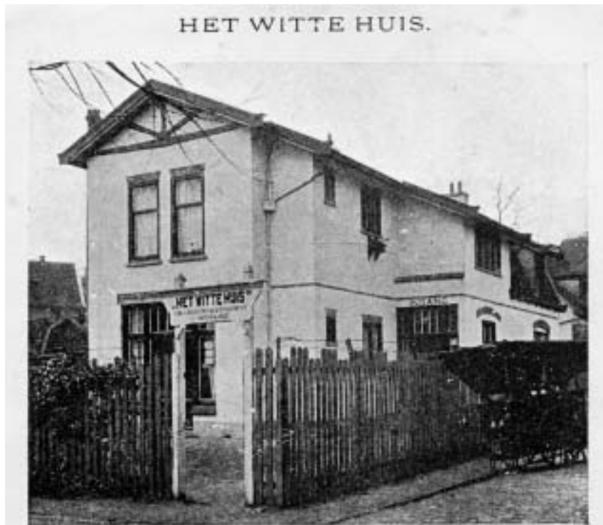
Chr. Geh. Onth. Hotel G. J. BALTINK, Noordsche Boschje 15a – Hilversum

Noordsche Boschje 15a, omstreeks 1927. Het Christelijk Geheel Onthouders Hotel. Je weet dat dat erin heeft gezeten, maar verder kom je er weinig informatie over tegen. Wie heeft het opgericht, hoelang heeft het hotel erin gezeten, hoe zag het ervan binnen uit? Dat soort dingen zou ik wel graag willen weten.