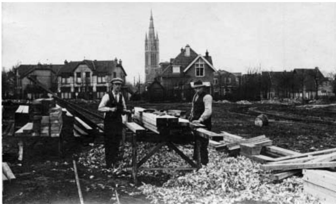
Nog een keer de Koningstraat. Hier kijk je op de woningen van de Koningstraat vanaf het nog niet bebouwde terrein tussen de Nassaulaan en de Wernerlaan. Er wordt gewerkt. Dit is een fotokaart waar geen uitgever of verder iets op vermeld is. Waarschijnlijk hebben de bouwers of de opdrachtgevers deze foto laten nemen. In een kleine oplage. Dat maakt zo'n kaart voor mij ook bijzonder.