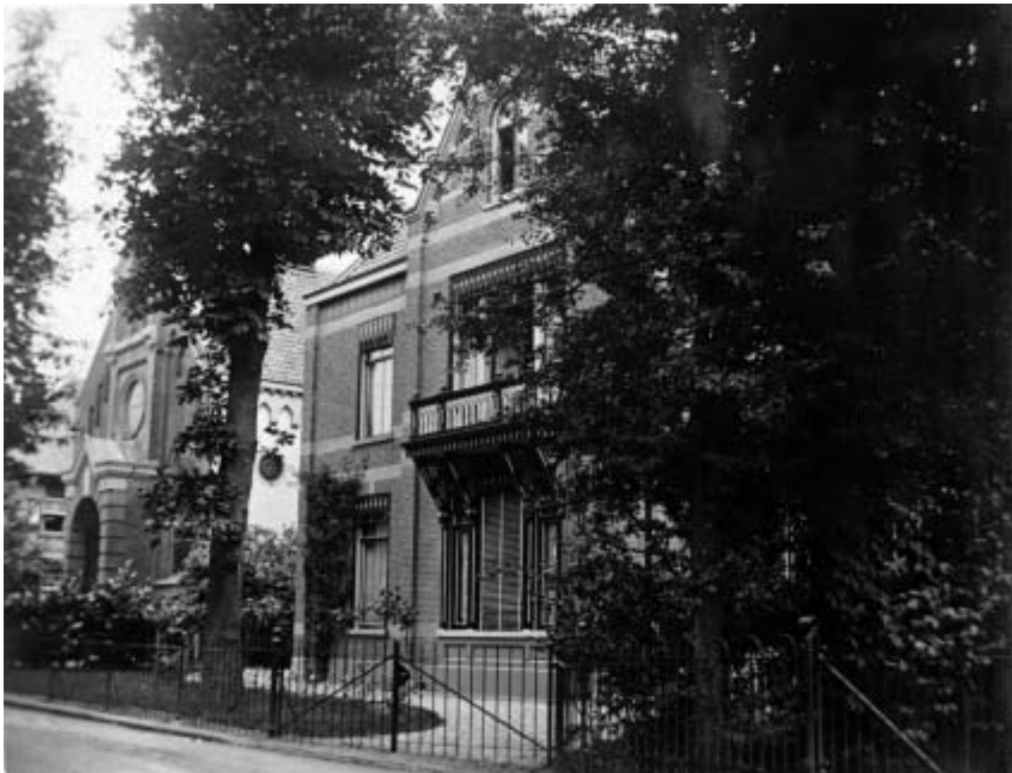
De Boomberglaan. Ook dit is een zeldzame oude fotokaart waar verder niets op staat. Het huis rechts is de pastorie van de doopsgezinde kerk met daarnaast de kerk zelf. De architect is G.B. Salm, samen met zijn zoon (A. Salm).

Emmastraat 48b, genaamd Marksland. Deze villa is afgebroken voor de nieuwbouw van de KRO-studio, aan de kant van de Koningsstraat. De kaart heeft een droogstempel van de fotograaf J.J. Kok. Hij zal dan ook wel de uitgever zijn.