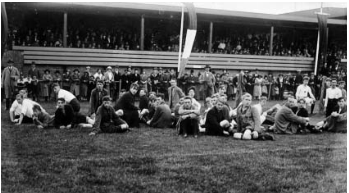
Het sportpark. Dit is een oude fotokaart zonder gegevens, waarschijnlijk gemaakt ter gelegenheid van het bezoek van Koningin Wilhelmina en Prinses Juliana op 11 augustus 1924 voor het 700-jarig bestaan van Hilversum.