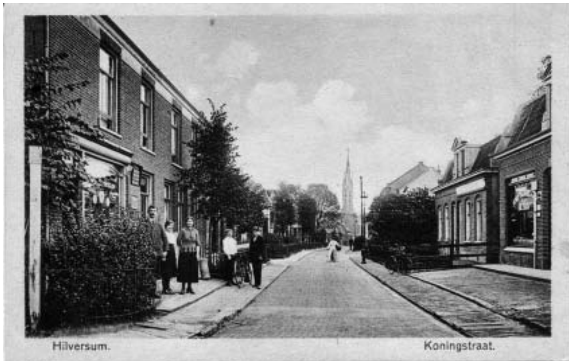
De Koningstraat omstreeks 1920. Het winkeltje links is nr. 124, op de hoek van de Oosterstraat. Ik ben iets verderop geboren, op nr. 128. Dit is een van de weinige foto's die er van de Koningstraat zijn.