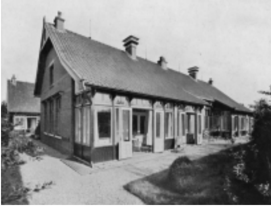
De nieuwe barakken voor besmettelijke zieken aan de Neuweg.

de 'erfgooierskwestie' en de ontwerpwedstrijd voor het nieuwe raadhuis. Van de vele tientallen overige – al dan niet heikele – onderwerpen laten we er een aantal de revue passeren.