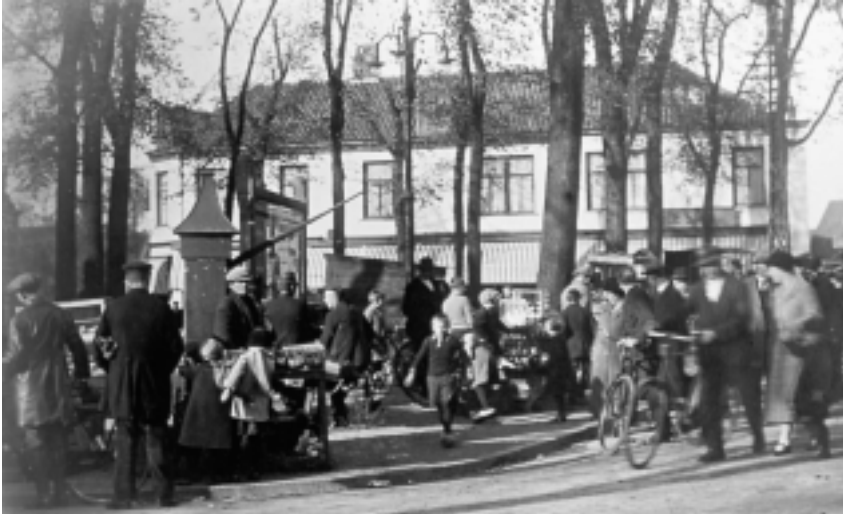
De wekelijkse warenmarkt op de kop van de Groest, met tussen de koopwaar een van de gemeentepompen.

boring had 650 gulden gekost. De gemeentearchitect had al becijferd dat verbetering van de overige zestien pompen op 400 gulden per stuk zou uitkomen. Veel te kostbaar, vond het college, dat voorstelde alle overige gemeentepompen te verwijderen en de putten te overkluisen.