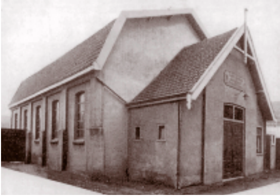
Gebouw van de Hersted Apostolische Zendingsgemeente aan de Violenstraat.

Het Hersted Apostolisch Zendingsgemeenschap gebouwd in 1902 aan de Violenstraat 76A. Deze beweging was afkomstig uit Engeland en opgericht door Edward Irving in 1833. Apostolischen vrouwen in principe de ambten toe aan de besten – dat is aan de meest charismatische persoonlijkheden (de apostelen). Dit stemt overeen met Gunnings idee dat God door (geheiligde) persoonlijkheden werkt. In 1907 zal zeer waarschijnlijk de nadruk hebben gelegen bij het apostelambt en de wederkomst van Christus. 3