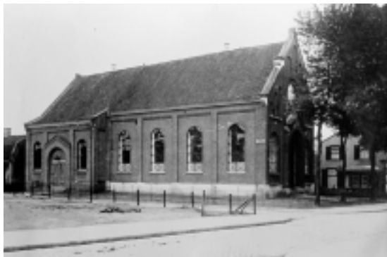
Gereformeerde Kerk A aan de Havenstraat.