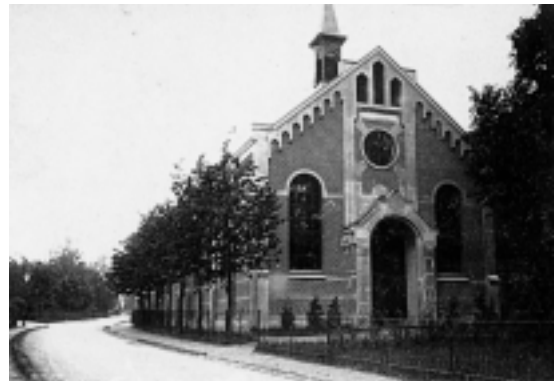
Het Evangelisatiegebouw aan de Alb. Perkstraat.

Lokaal “ De Beurs ” aan de Prinsenstraat 16. Met de fusie van de beide gemeenten kon een deel van de Gereformeerde Kerk A zich niet verenigen. Deze stichtte in 1906 een eigen kerk: de Christelijk Gereformeerde Gemeente. Zij hielden bijbellezingen aan de Prinsenstraat, waar ook de jongelings- en knapenvereniging vergaderden. Een dienst met dominee werd gehouden in het