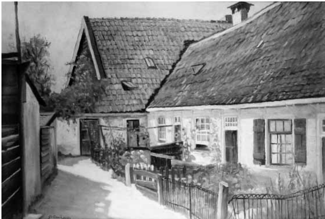
Het schilderij van G. van Schaik: Oude Torenstraat 13 t/m 17.