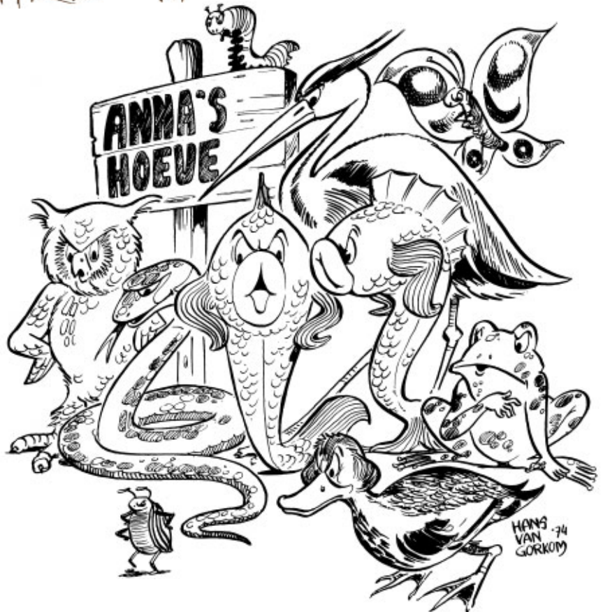
Aandacht voor de ons omringende natuur en de dieren die daar leven. HIK 30 april 1974 en 26 mei 1978.

bewoner tegen de afsluiting van de Ruitersweg. De actiegroep Diependaalselaan die aandacht vroeg voor de onleefbare situatie aan die laan. Inderdaad: over de verkeerssituatie in Hilversum raken we niet uitgepraat!! Het is een discussie van alle tijden.