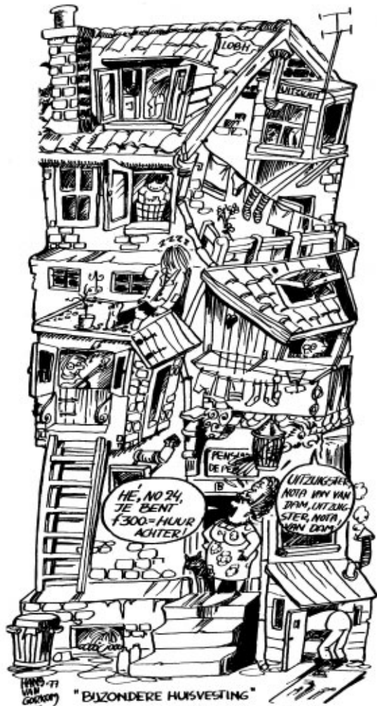
Commentaar op huisjesmel- kers en op discriminatie bij de Hilversumse nachtclubs.

oktober 1981 een echt verenigingsblad kreeg met de naam 'Eigen Perk'. De reden om in HIK te publiceren was daarmee weggevallen.