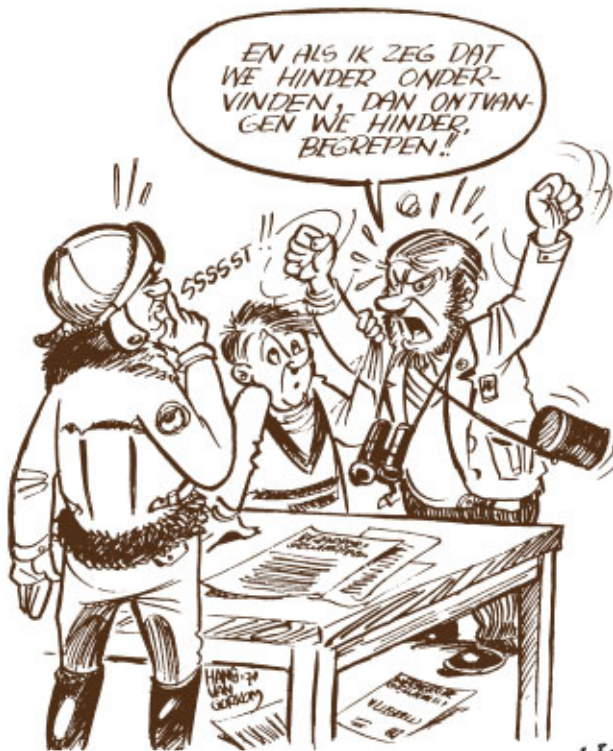
De werkgroep Geluidshinder Vliegveld maakte bij tijd en wijle meer herrie dan de vliegtuigjes. HIK 31 maart 1978.