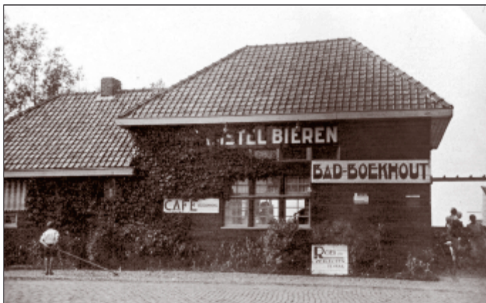
De oprichting van de HZC vindt plaats in de gelagkamer van het Loosdrechtse Bad Boekhout.

saris. Allen hadden wel enige organisatorische ervaring, maar waren zwemtechnisch volkomen leken. Het starten-de ledenaantal bedroeg 55.