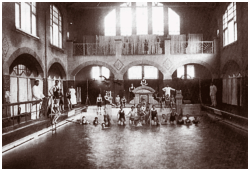
De Overdekte aan de Badhuislaan.

Een van de eerste doelstellingen van het toenmalige bestuur was het bemachtigen van zwembaden voor de H.Z.C. in "de Overdekte", het in 1913 geopende zwembad aan de Badhuislaan in Hilversum. Overleg met de directeur van het zwembad en de gemeente, die garant stond voor het exploitatiekosten, liep in eerste instantie op niets uit. Na lang aandringen en uiteindelijk met medewerking van de gemeente kon de H.Z.C. uiteindelijk ook 's winters in verenigingsverband zwemmen.