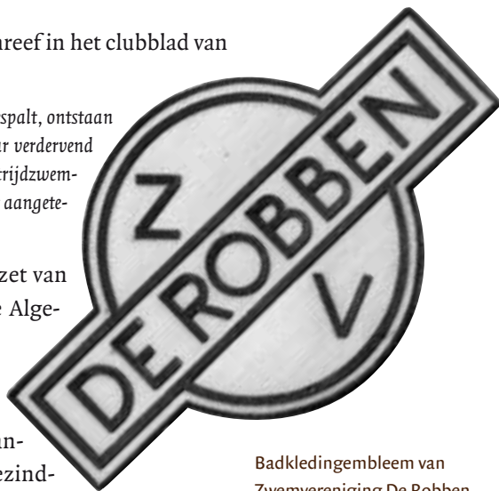
Badkledingembleem van Zwemvereniging De Robben.

Eindelijk is dan toch de bom gebarsten. Eindelijk is het gif der tweespalt, ontstaan door een misplaatst begrip der werkelijkheid, in staat geweest haar verdervend werk in ons groote H.Z.C.-gezin te volbrengen. De groep wedstrijdzwemmers(sters) heeft namelijk, onder auspiciën van haar trainer, verzet aangetekend tegen het bestuursbeleid.