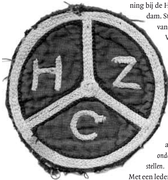
Badkledingembleem uit de beginjaren van de HZC.

ning bij de H.D.Z.C., de Hollandse Dames Zwem Club in Amsterdam. Stender is de H.D.Z.C. trouw gebleven tot aan het einde van de Tweede Wereldoorlog.