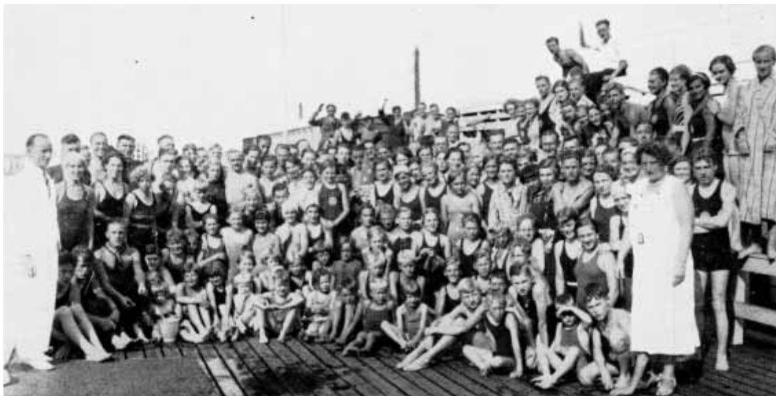
De zwemgroep van de H.Z.C. in 1932.