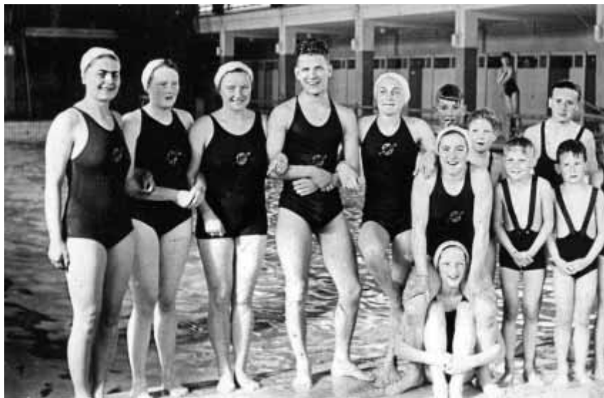
Een Robbengroep in de Kapelstraat vlak na de oprichting.