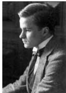
Een jonge Jany Roland Holst.

Adriaan ('Jany') Roland Holst (1888-1976), dichter, woonde op Lindenheuvel en in Villa Speranza (nu afgebroken) op de 's-Gravelandseweg 86. Bezocht in Hilversum de lagere school en de gemeentelijke HBS (nu A. Roland Holst College).