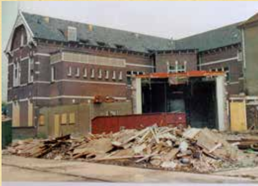
Mei 1991, sloop.

Het gebouw uit 1898 moest worden gesloopt om plaats te maken voor nieuwbouw. Het Rijk had het gebouw verkocht aan Ergon Beheer BV uit Apeldoorn. De buurt maakte zich hevig zorgen. Ergon bouwde van alles. Van winkels, woningen, kantoren tot kleinschalige villa's, zo las men in de krant. De burens moesten er niet aan denken dat er een winkelcentrum zou komen! Gelukkig hield de gemeente de vinger aan de pols en moest Ergon zich houden aan het bestemmingsplan voor het gebied. In diezelfde tijd gaven de buurtbewoners schriftelijk te kennen dat ze op korte termijn gekend wilden worden in de nieuwbouwplannen. Na jarenlang wachten in