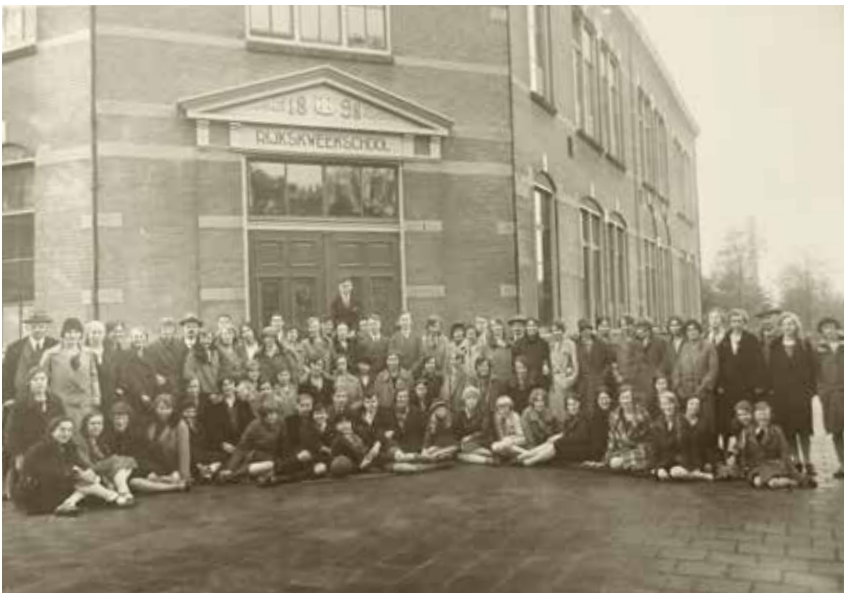
Personeel en leerlingen, ca. jaren dertig, aan de Jonkerweg.