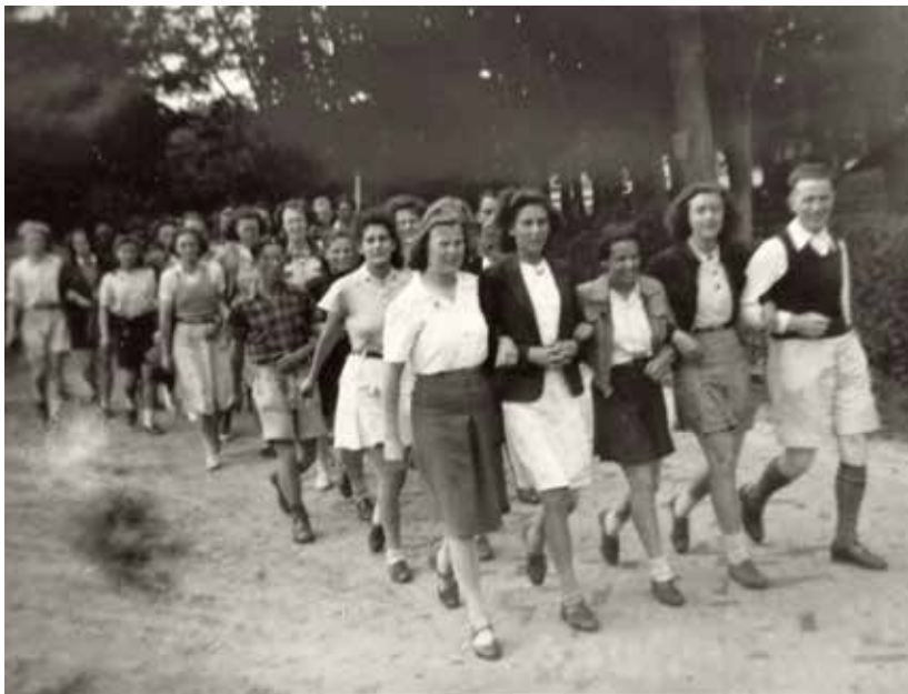
Werkweek Volkshogeschool Overcinge, juli 1946.

In september 1957 ging de vijfjarige opleiding van start, met de opleiding tot volledig bevoegd onderwijzer (hoofdakte) als vast onderdeel.