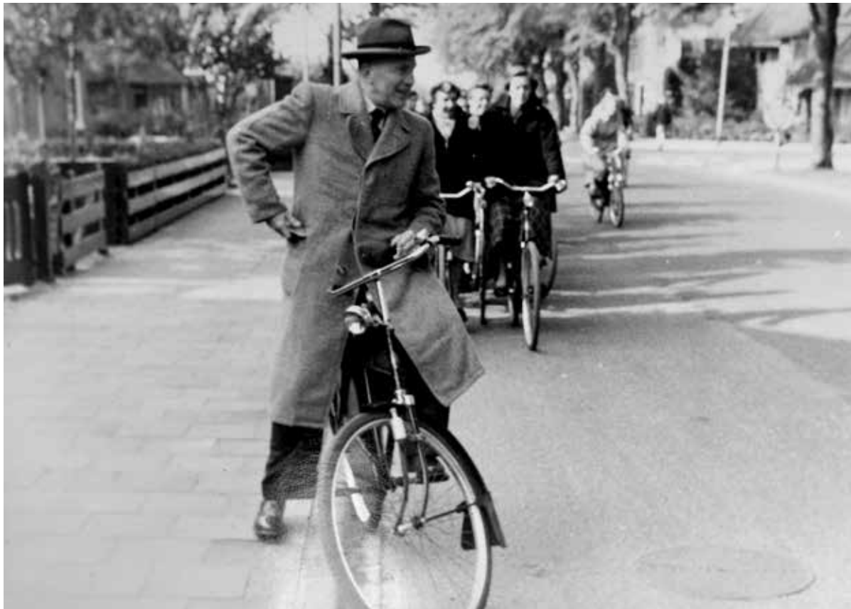
4 juli 1955. Directeur IJzer van huis gehaald op Loosdrechtsweg 57, t.g.v. jubileum veertig jaar onderwijs.