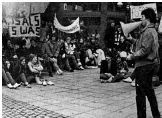
Eind jaren zeventig, zitactie op pleintje tegenover C&A, tegen beleid van onderwijsminister Pais (coll. Stevens).

Een Hilversumse ex-wethouder schreef een verontwaardigde brief naar B en W over een PvdA-verkiezingsbiljet op de binnenzijde van een raam van de school. Deze school staat bekend als zeer rood. Verkiezingspropaganda op rijksgebouwen door ambtenaren gaat ver over de schreef.