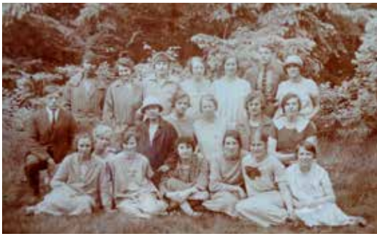
Eerste eindexamenklas Rijkskweekschool in de tuin van Witten Hull, 19 juni 1926 (foto coll. Jos De Ley).