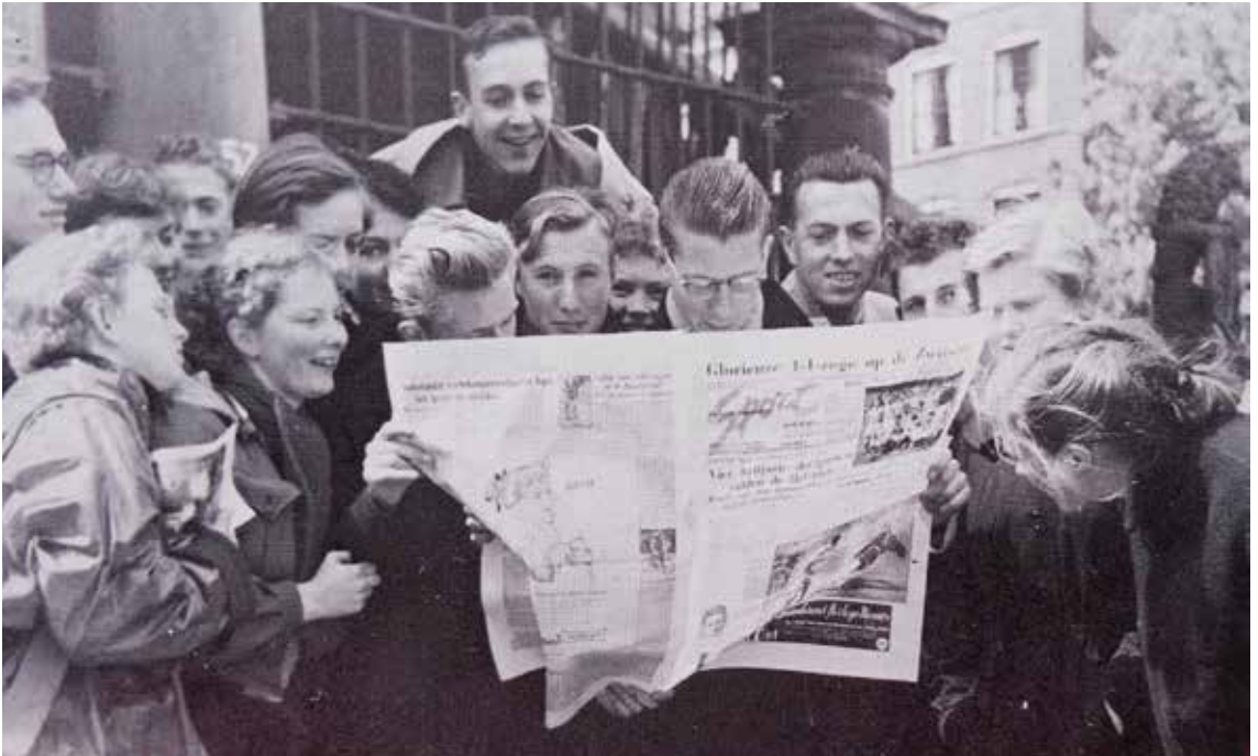
Werkweek Epe, 1955.

In het amfitheater waar de lessen van Fleers normaliter rustig verliepen, was er twee keer per jaar tien minuten grote onrust! Dat ging zo: Ineens stoven we met z'n allen naar het raam. Circus Strassburger kwam voorbij, op weg naar de winterstallen onderaan de Jonkerweg. Als een stel kleuters keken we onze ogen uit naar de olifanten, de tijgers achter de tralies en naar de clowns die fratsen uithaalden. Na tien minuten liepen we weer rustig naar onze plaats. Fleers kon hier niet tegenop, hij liet het dus maar gebeuren, verbieden had geen zin, dat snapte hij ook wel.