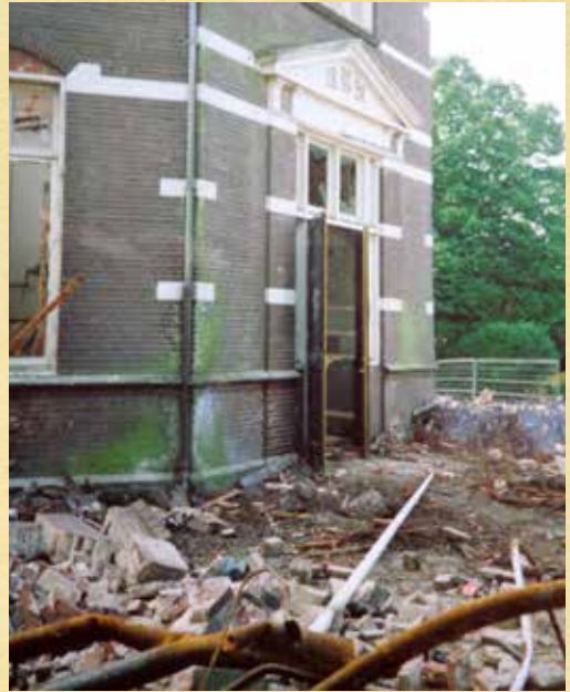
Mei 1991, einde verhaal.

onzekerheid zagen zij het schoolgebouw in 1991 eindelijk gesloopt worden, gelijk met het neerhalen van vele monumentale bomen. Voor het mooie schoolgebouw, zoals een van de burens schreef, is nu een oerlelijk luxe appartementencomplex in de plaats gekomen, de Résidence Schuttersheide.