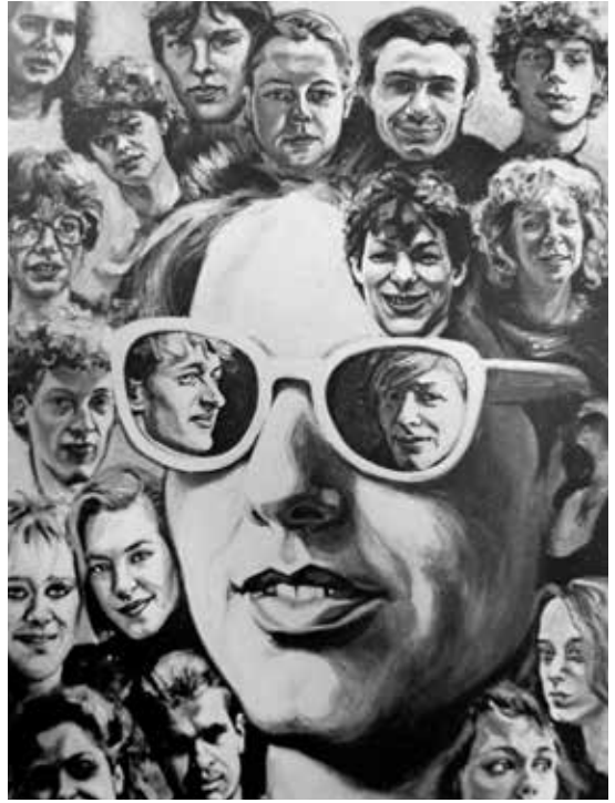
Schilderij van Anke Louwerse, gemaakt t.g.v. diploma-uitreiking havo 5 mei 1984, symboliseert de band tussen leerlingen en docenten. (uit: Fotoboekje t.g.v. sluiting school 1985).

Op 1 juli 1985 viel definitief het doek. Maar niet nadat de RPA in Hilversum op 15 en 16 juni een daverend slotfeest