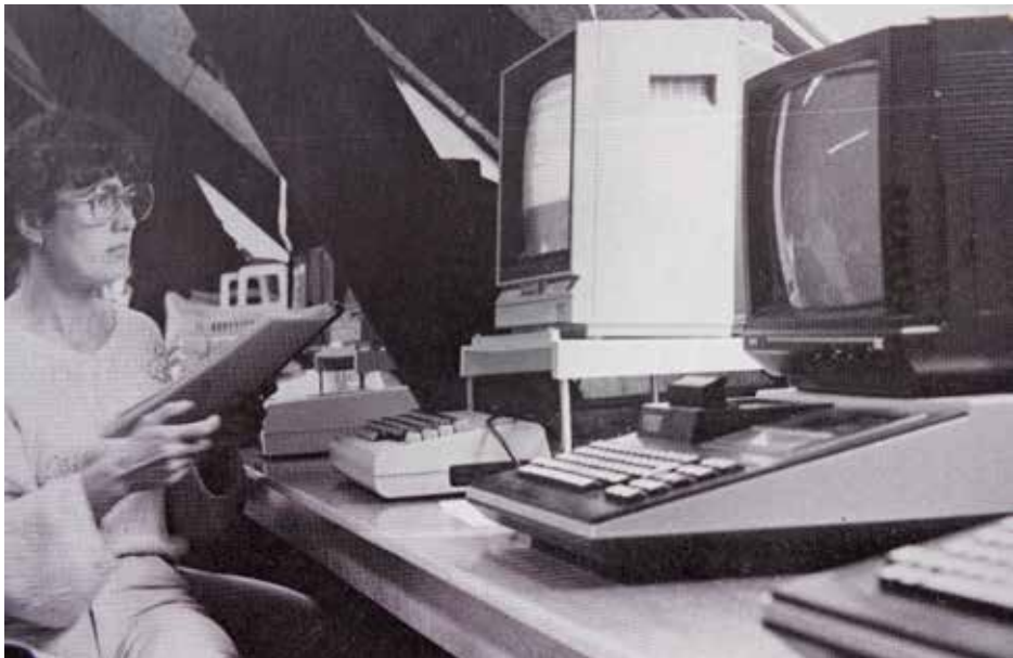
De nieuwe tijd. Computerlokaal op zolder, waar in de jaren tachtig lesprogramma's werden ontwikkeld.