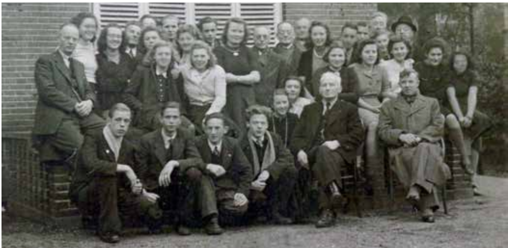
Eerste en tweede klas, 1945, tijdelijke locatie aan de Graaf Florislaan.

Na de bevrijding namen Canadese soldaten het gebouw tot eind 1945 in beslag. De uitgewoonde school leek op een bouwval en heette sindsdien de Paardenstal. De schoolkrant werd De Ruif genoemd, leesvoer voor leerlingen, analoog aan voer voor paarden.