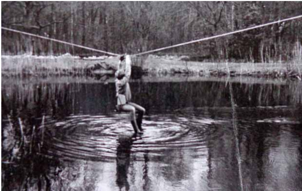
Survival in Rockanje, 1968 (uit: Fotoboekje t.g.v. sluiting school 1985).