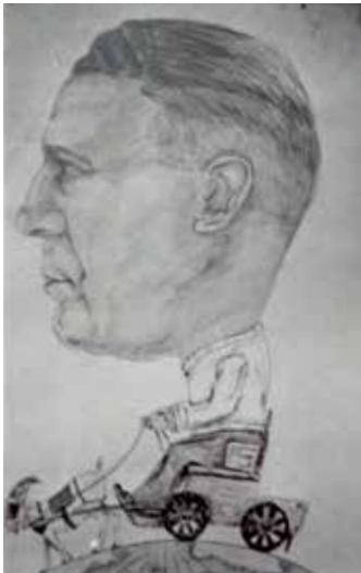
Cartoon van Remko IJzer, gemaakt voor een 'Amerikaanse verkoping' om de kas te spekken voor de werkweek 1947.

school er netjes uitzag en goede manieren dienden in acht te worden genomen, maar een grapje kon er altijd wel af.