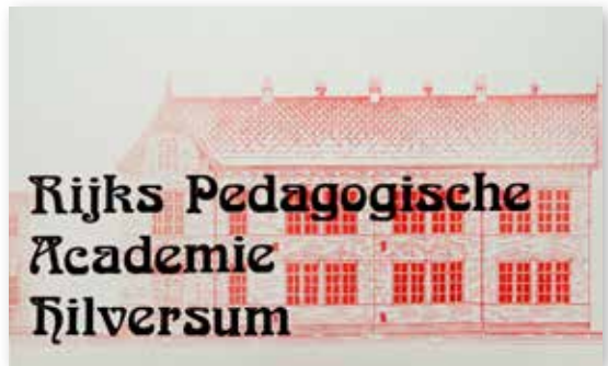
Omslag Fotoboekje t.g.v. van de sluiting van de school, 15 en 16 juni 1985.