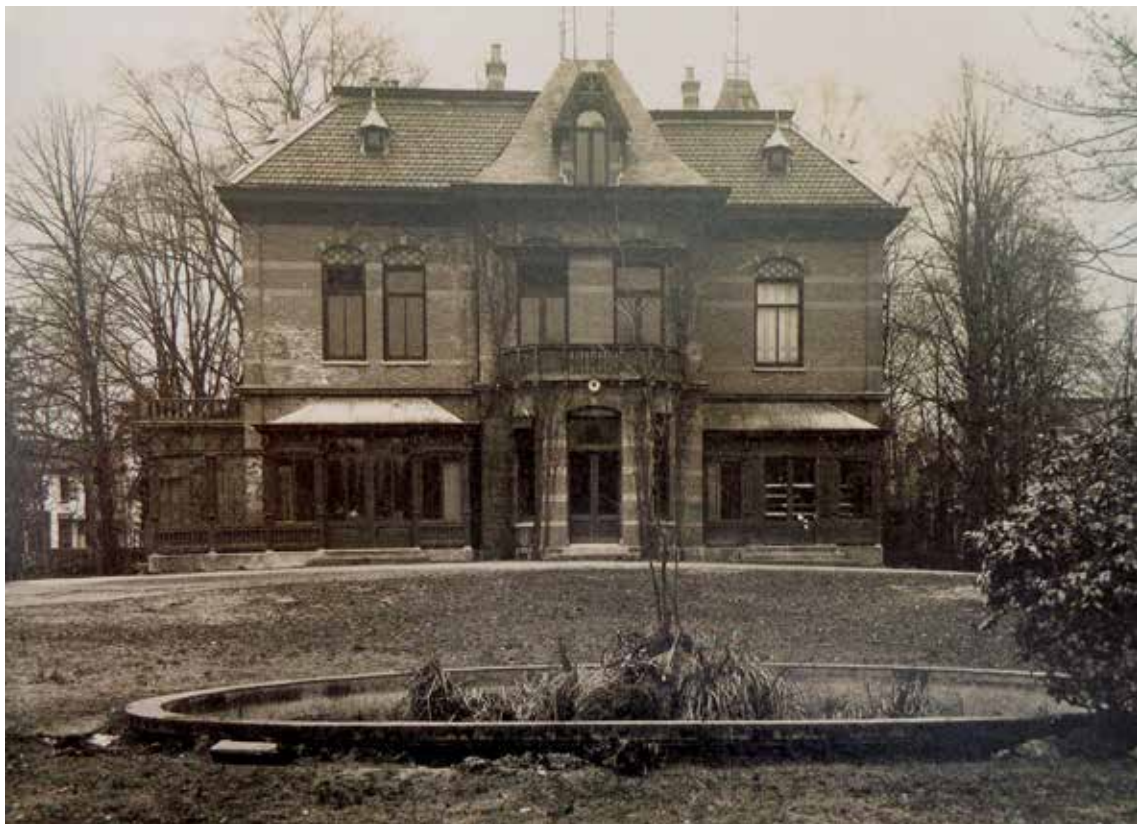
Villa Witten Hull (uit: Raadhuis Hilversum, een gebouw voor eeuwen, uitg. Waanders).

In 1909 werden er in Hilversum aan de Huygensstraat rijksnormaallessen gegeven aan aanstaande onderwijzers, zowel 's avonds als overdag. Uit gemeentelijke stukken blijkt dat er vaak gebrek aan van alles was: bankjes, schragen, schoolborden, ook aan lokalen. Er werd geregeld verhuisd: Badhuislaan, Violenstraat en Nieuweg. Burgemeester en wethouders hadden het er maar druk mee. Toen de avondlessen in 1923 vervielen, bleef de Rijksdagnormaalschool over.