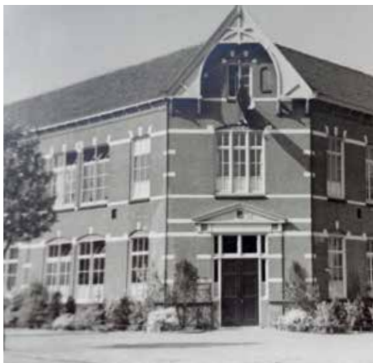
Jonkerweg 1, jaren vijftig foto.