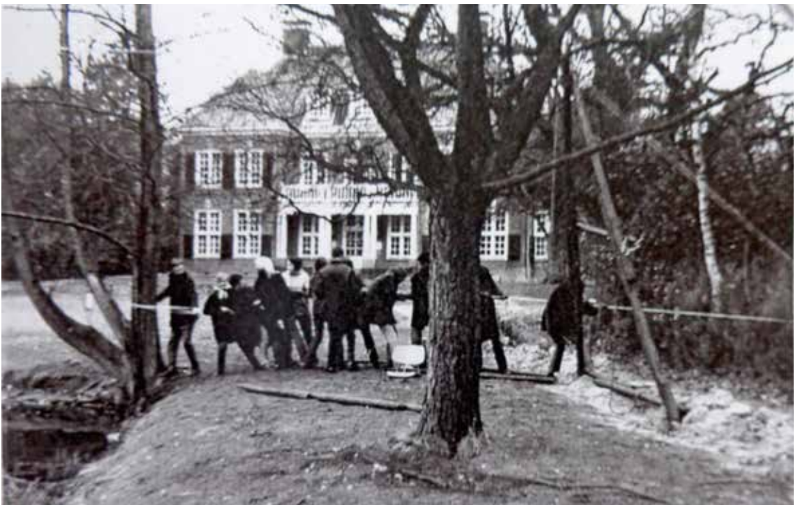
Volkshogeschool Olaertsduyn in Rockanje, 1968 (uit: Fotoboekje t.g.v. sluiting school 1985).

De excursies, werkweken en sportdagen die in de jaren vijftig waren begonnen, namen in de volgende decennia toe. Werkweken werden gehouden in volkshogescholen Bakkeveen, Havelte, Eerbeek, Huis ter Heide of Bergen. De leerlingen gingen er op de fiets naartoe. Er werd aan culturele en sportieve uitwisselingen gedaan met zusteropleidingen in het land, zoals de Haagse Rijkskweekschool. Degenen die voor de akte L.O. Frans studeerden, konden deelnemen aan een uitwisseling met een Franse kweekschool. Ook het destijds nog verdeelde Berlijn behoorde tot de excursiemogelijkheden, waar zowel naar de Berliner Philharmoniker werd geluisterd als naar een toespraak over de voordelen van het onderwijs in de DDR.