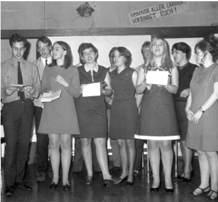
Werkweek in de Harz, maart 1969.

De excursies, werkweken en sportdagen die in de jaren vijftig waren begonnen, namen in de volgende decennia toe. Werkweken werden gehouden in volkshogescholen Bakkeveen, Havelte, Eerbeek, Huis ter Heide of Bergen. De leerlingen gingen er op de fiets naartoe. Er werd aan culturele en sportieve uitwisselingen gedaan met zusteropleidingen in het land, zoals de Haagse Rijkskweekschool. Degenen die voor de akte L.O. Frans studeerden, konden deelnemen aan een uitwisseling met een Franse kweekschool. Ook het destijds nog verdeelde Berlijn behoorde tot de excursiemogelijkheden, waar zowel naar de Berliner Philharmoniker werd geluisterd als naar een toespraak over de voordelen van het onderwijs in de DDR.