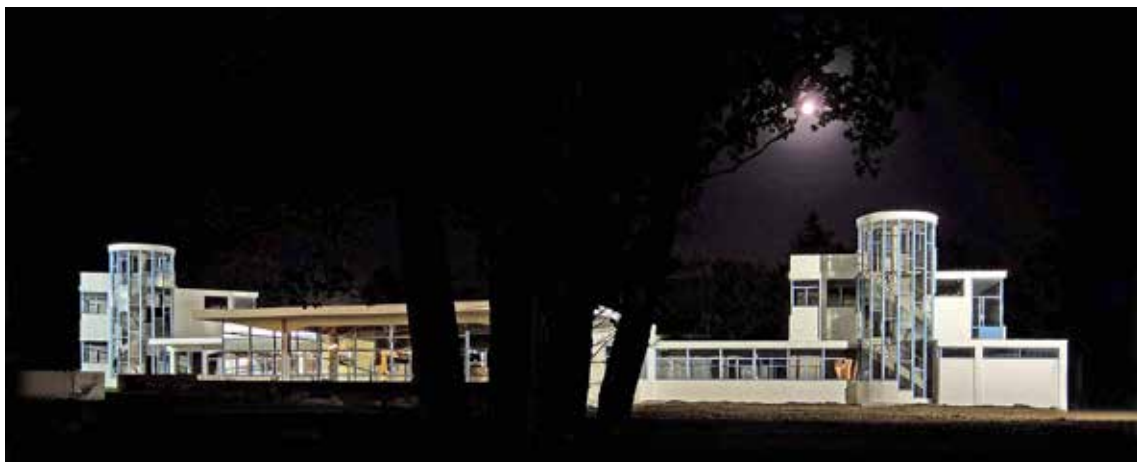
Mooie buitenkant Dressel-huyspaviljoen, maar binnen is al vijf jaar niets gedaan.