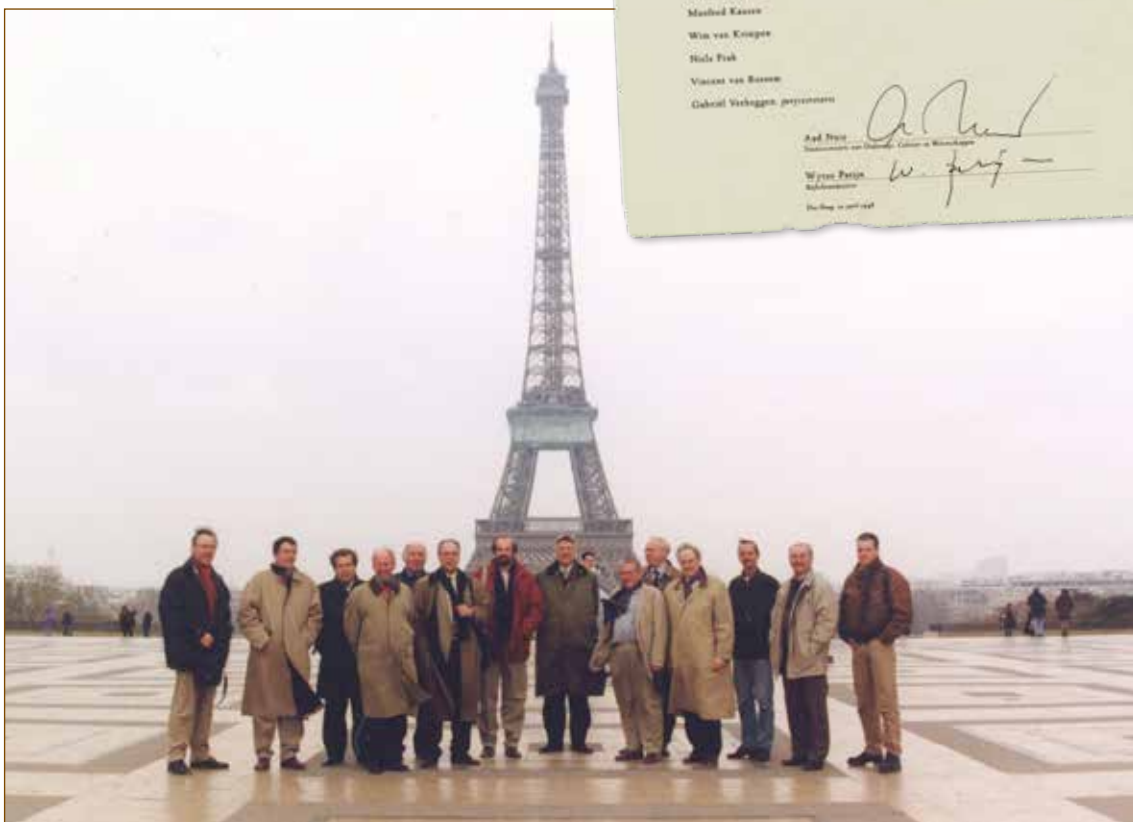
Na restauratie ging het bouwteam op eigen kosten naar Parijs om daar een bezoek aan Dudok's Studentenhuis te brengen, met een compleet plan tot restauratie als gevolg.