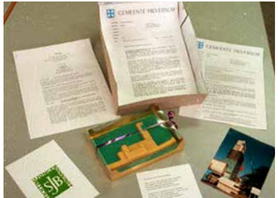
Om minister d'Ancona mee te krijgen met de raadhuis-restauratie bedacht Arie een list en liet bij alle kamerleden op Sinterklaas thuis bezorgen met een marsepeinen raadhuisje.