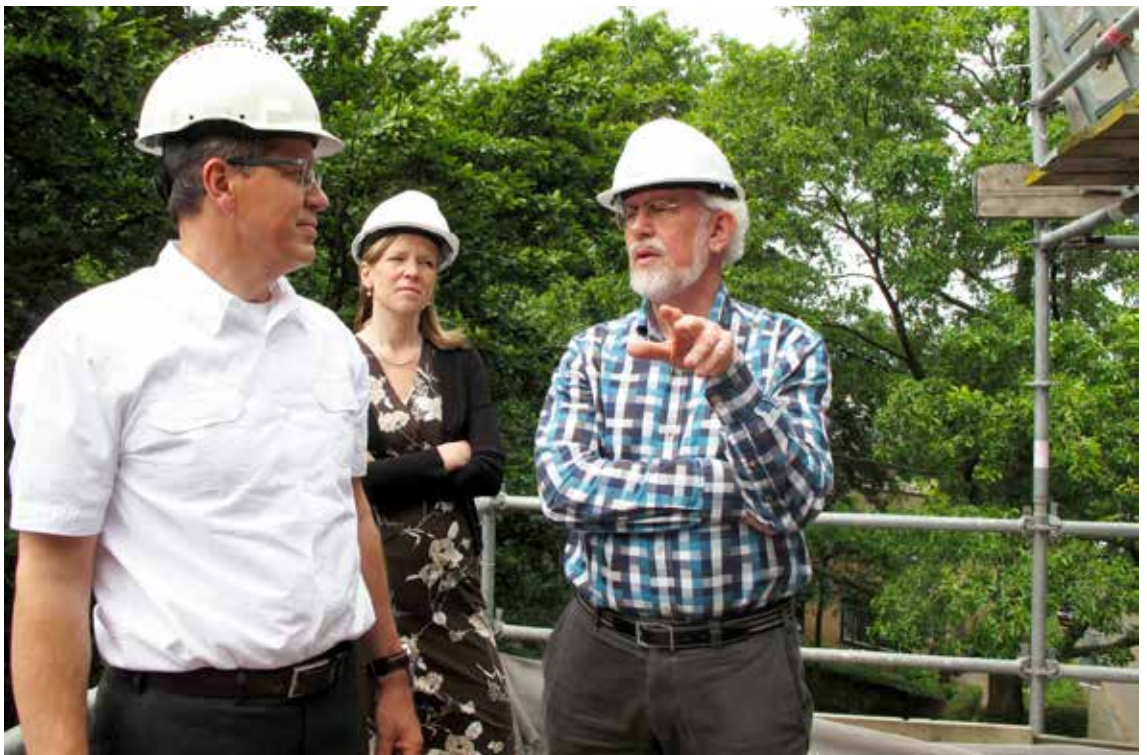
Op de steiger tijdens de restauratie van de Clemenskerk.