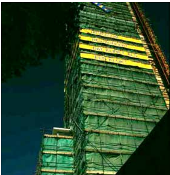
Een veelzeggende tekst aan de toren in restauratie.

De oorkonde behorende bij de Pyramide Monumentenzorg van de rijksprijs voor excellent opdrachtgeverschap.