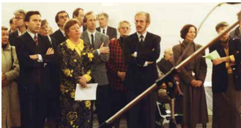
Brinkman bij officiële start restauratie Gooiland.