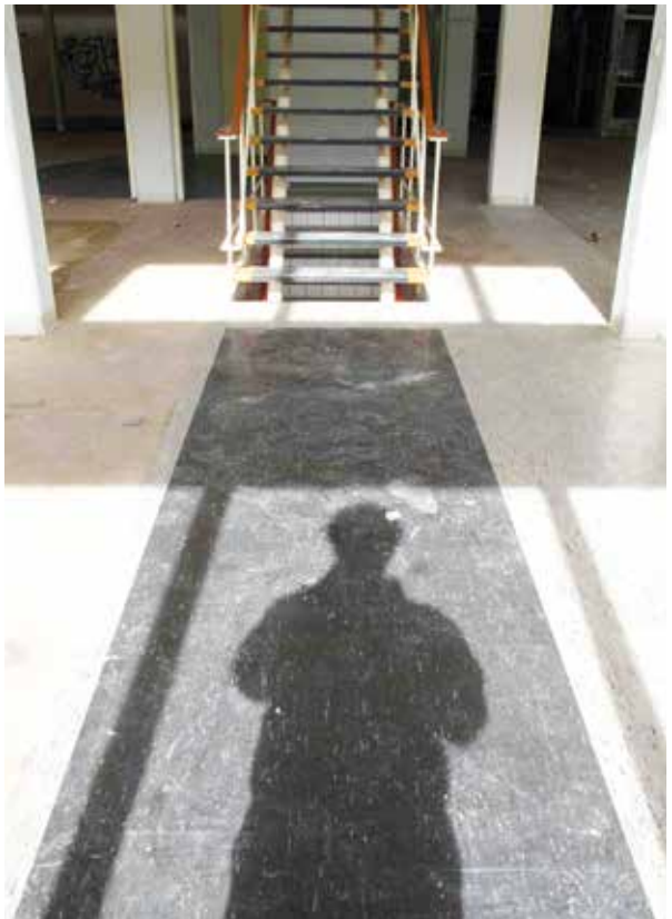
Arie fotografeert zichzelf op een stuk originele linoleum in het muziekpaviljoen (helaas weggehaald door TCN).