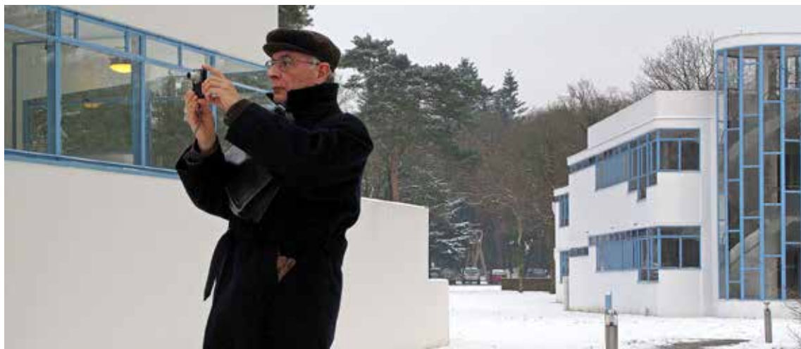
De hoofdarchitect van de stad Parijs, verantwoordelijk voor de restauratie van de Franse Dudok, legt het gerestaureerde Zonnestraat op foto vast.