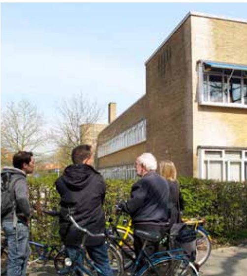
Met collega's RCE bij Lorenschool ; overleg over mogelijke uitbreiding.