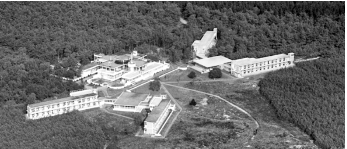
Het gaat mis met Zonnestraal als in de nabijheid van de Duiker-monumenten grote nieuwbouw en grote parkeerplaatsen worden aangelegd; dan kan Hilversum fluiten naar Werelderfgoedstatus.