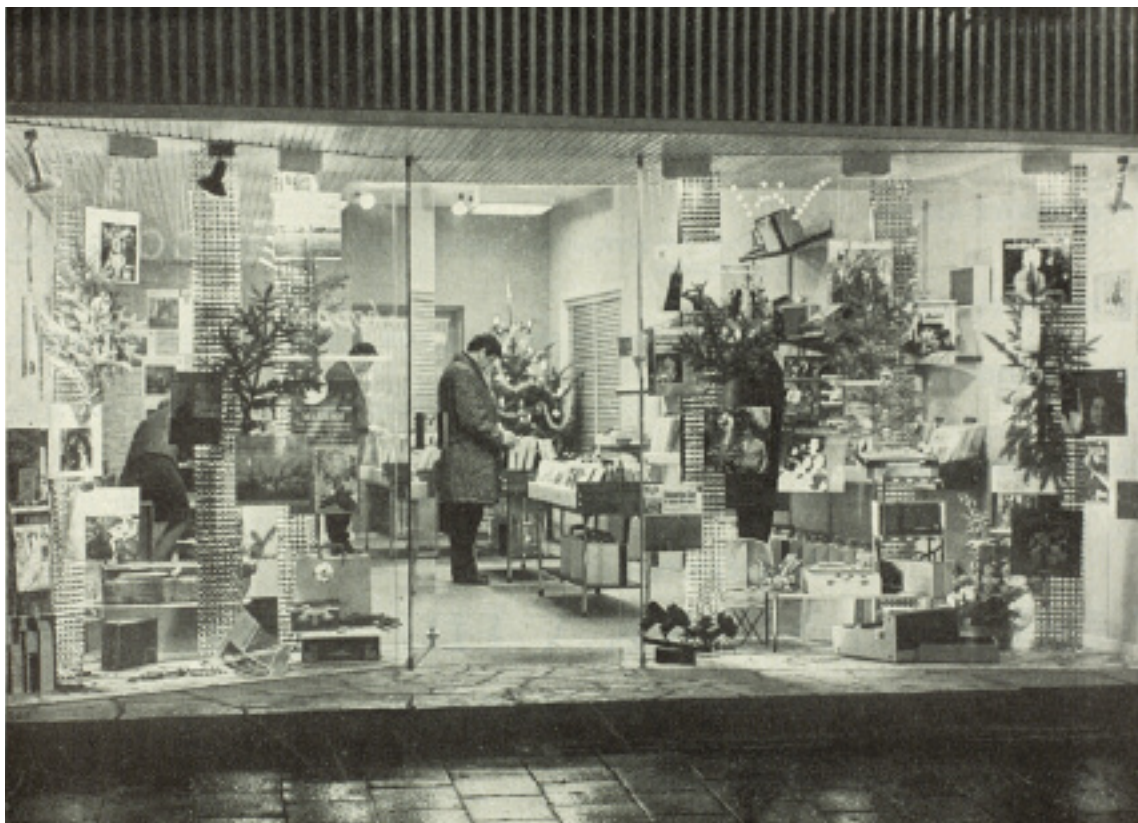
Muziekwinkel in kerstsfeer