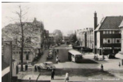
De Stationsstraat in 1952

In uitverkooptijd sloop ik er wel drie keer per dag binnen, want de immer over zijn halvemaanvormige leesbril heen kijkende De Roos vulde voortdurend de bakken bij.