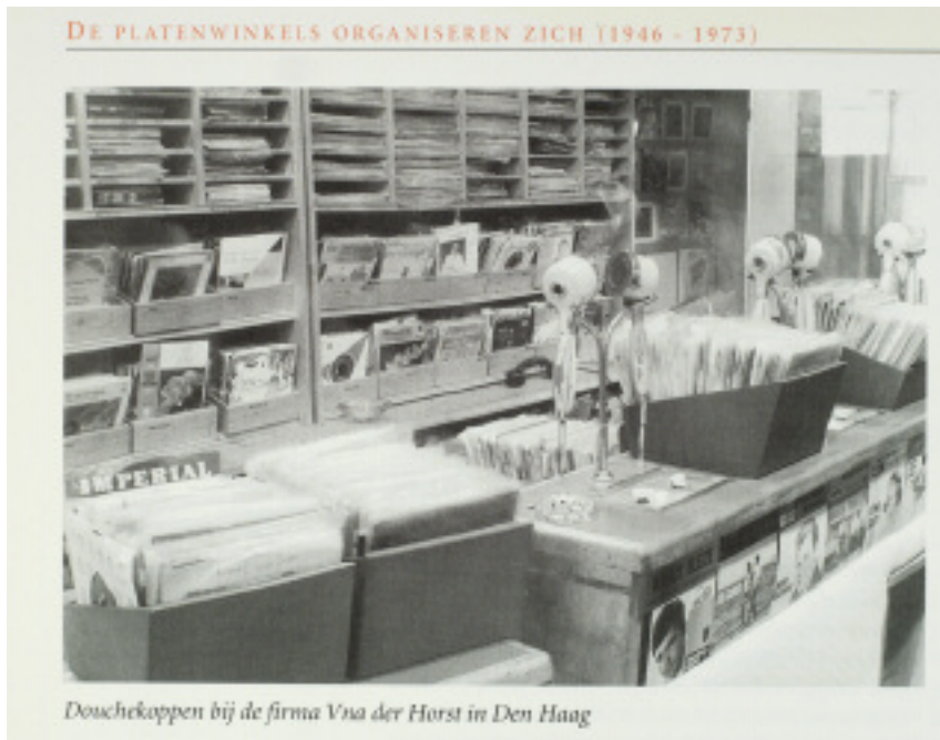
Douchekappen bij de firma Vna der Horst in Den Haag