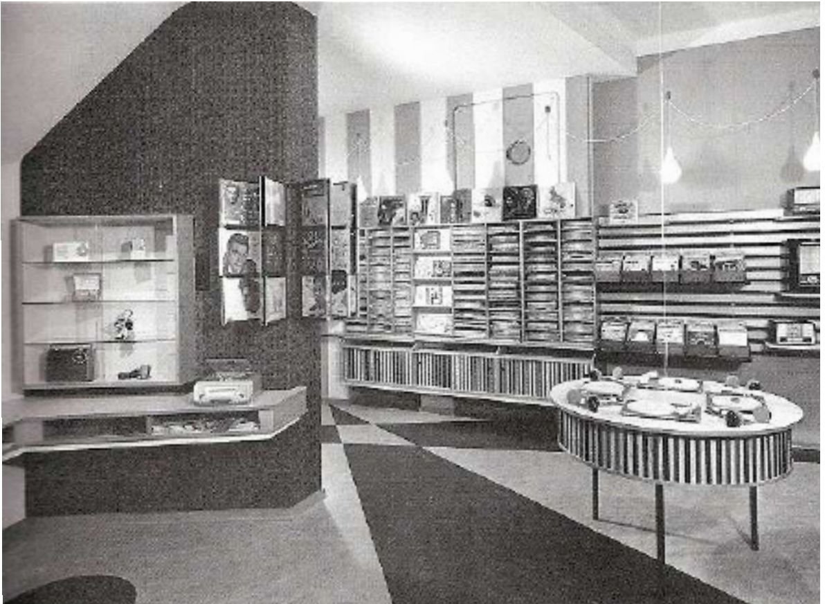
Een wel heel fraaie interieurfoto. Top fifties design. Let op de Triotrack grammofoons die zijn ingebouwd in de luis-tertafel. De foto is gemaakt in een platenzaak in Hilversum, de interieurarchitect is W. Bauer.

name, met ongekende montage- en effectmogelijkheden, geven veel opnamen van de laatste dertig jaar iets kunstmatigs mee, nog geaccentueerd door de doodstille en kil aandoende achtergrond. Maar of je dat de brenger van de boodschap kunt verwijten? Ik koester mijn langspeelplaten en geniet van mijn cd-collectie. Maar een romantische avond platen draaien bij de open haard is toch iets speciaals. Alleen al die pracht lp-hoezen. Daar kan dat glibberige cd-doesje niet tegenop, om maar te zwijgen over het cd-boekje dat haast niet uit het doesje is te peuteren.