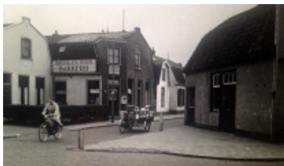
Kwakernaak, Leeuwenstraat hoek Kampstraat.

De His Master's Voice-plaat is grijsgedraaid maar na een halve eeuw nog steeds in goede conditie. Kunnen digitale media dat al nazeggen? Later zou ik deze firma nog wel eens aandoen om spullen te verpatsen: want dancing en testosteron wonnen het enkele jaren van de muziek. Ik verkocht de eigenaar in 1965 een stapel mono lp's om een feestweek te bekostigen (in 1958 ging de platenwereld op stereo over en dat maakte mono ouderwets). In die jaren sjabloneerde ik heel deftig mijn naam op elke hoes en wie schetst mijn verbazing toen ik een deel van