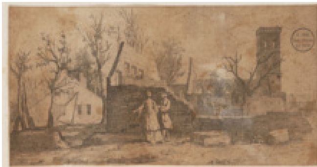
Ets van de ruïne na de brand met initialen M.H.

De berichtgeving in de kranten kwam groten-deels overeen. Elke krant vond het belangrijk om