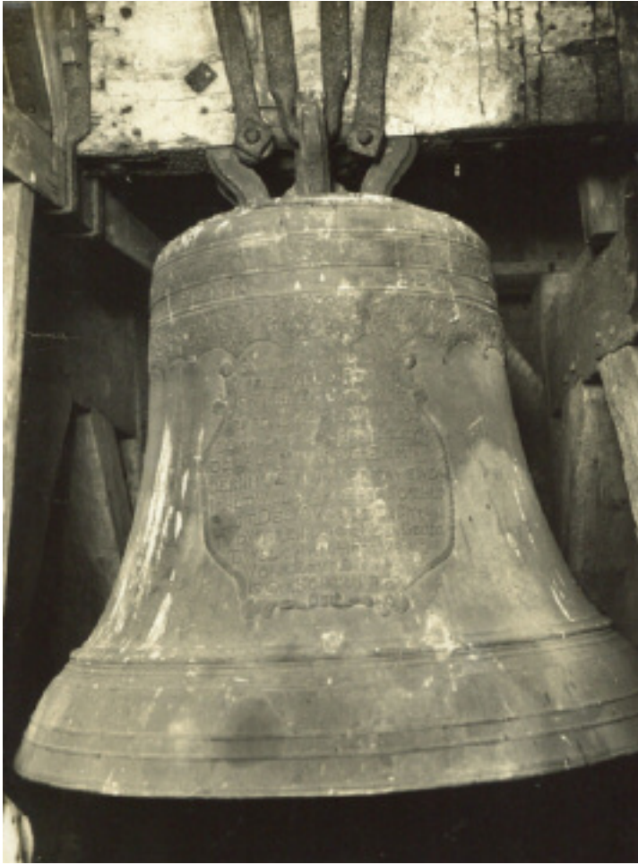
Op de kleine klok was een rijmpje aangebracht, waaruit blijkt dat deze dagelijks werd geluid om het begin en einde van de dag aan te geven. Beide klokken werden in 1943 gevorderd door de Duitsers. (coll Kuijper)

gy zyt Rechtveerdig, ende elk een uwer Oordeelen is recht. Waarby veele Toehoorders, aldaar in meenigte vergaderd, de tranen uit de oogen geperst werden. 4