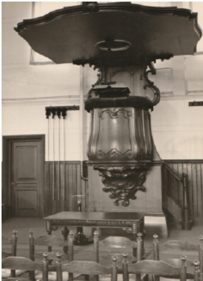
De preekstoel uit 1768 heeft ruim tweehonderd jaar dienst gedaan tot hij in 1971 bij de brand van de Grote Kerk verloren ging.

september, bij goed weer, zou de spits op de toren geplaatst worden. Vermoedelijk heeft deze gebeurtenis een enthousiaste schare toeschouwers getrokken. De herbouwde kerk werd op 3 juli 1768 ingewijd door de nieuwe dominee Van Yssum. 5