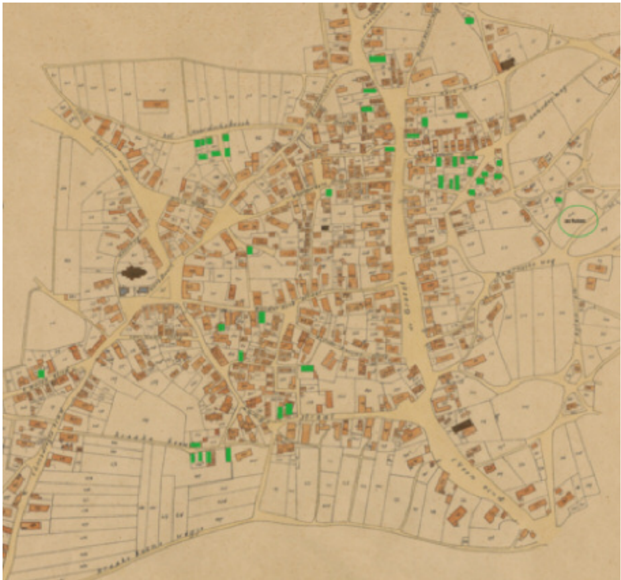
De (pre)kadastrale kaart van 1824. In groen aangegeven de nieuwe huizen, die in de periode 1725-1732 werden gebouwd. De zes huisjes in de buurt van de cirkel hebben er maar kort gestaan.

lend in de lijst is het aantal nieuwe huizen aan de Leeuwenstraat (het hele oneven deel) en het daar in de buurt gelegen gebied, 24 in totaal. Dat doet vermoeden dat de brand van 1725 ter hoogte van de Leeuwenstraat is begonnen.