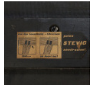
Instructie salontafel. (part. coll.)