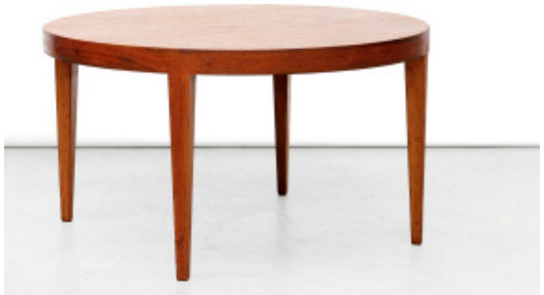
Salontafel nr. 468, ontwerp Severin Han- sen jr. Producent Ha- slev Mobelfabrik.

woninginrichting 'My Home' aan de Langestraat 78. Dit bedrijf werd geleid door twee broers van Ko van den Bovenkamp, namelijk Bob en Jo(op).