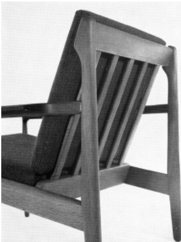
Fauteuil 'Birthe' naar een ontwerp van Madsen & Schubell. (part. coll.)

namelijk van lichtbruin, soms met oranje partijen tot rood- en donkerbruin. Bovendien heeft deze houtsoort vaak een specifieke adertekening. De stoffering van fauteuils en banken werd normaliter betrokken van de firma De Ploeg uit Bergeyk. Huisontwerper Nico Daalder was verantwoordelijk voor de meubelstoffencollectie, bijvoorbeeld de gewezen wollen meubelstoffen of bouclé stoffen, befaamd vanwege hun duurzaamheid.