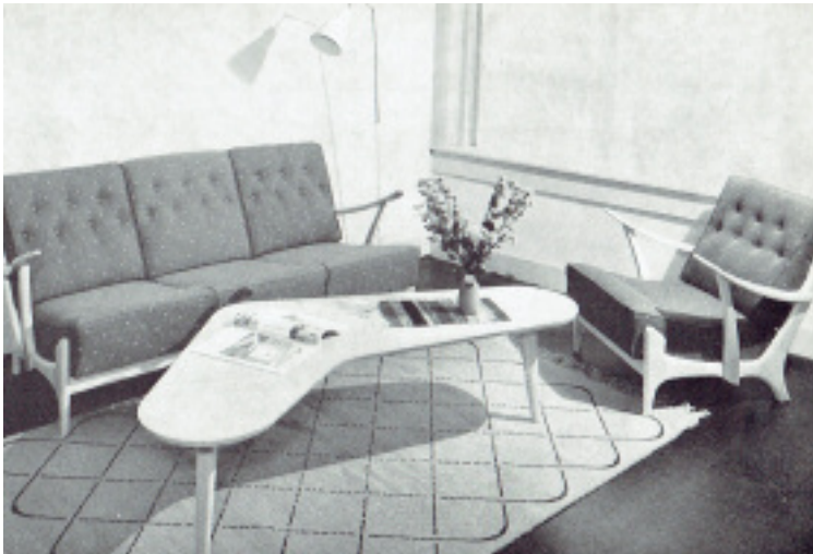
Bankstel 'Jolanda' en salontafel 'Irene'. (part. coll.)