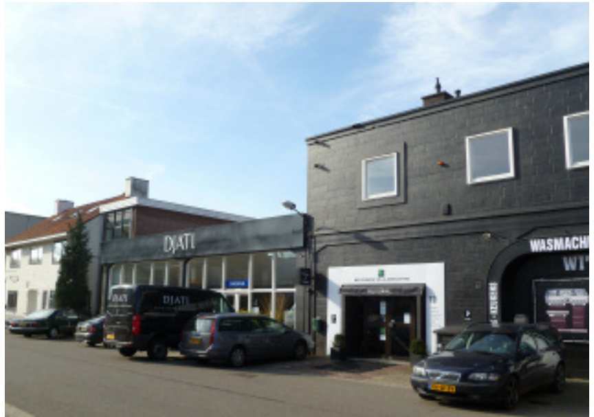
Situatie 2e Loswal, 2015.

Advertentie Nieuwsblad van het Noorden , 26 oktober 1963.