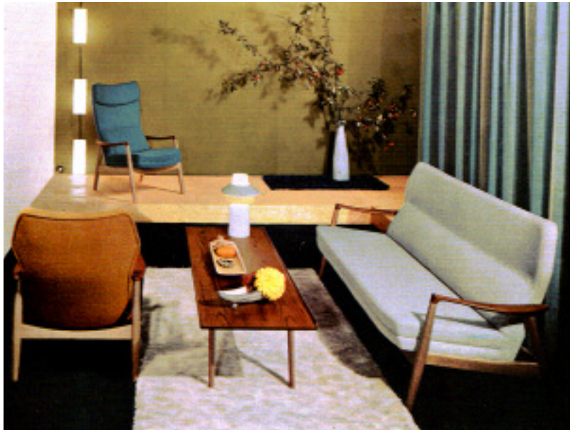
Bankstel 'Mette', ontwerp Madsen en Schubell. (part. coll.)