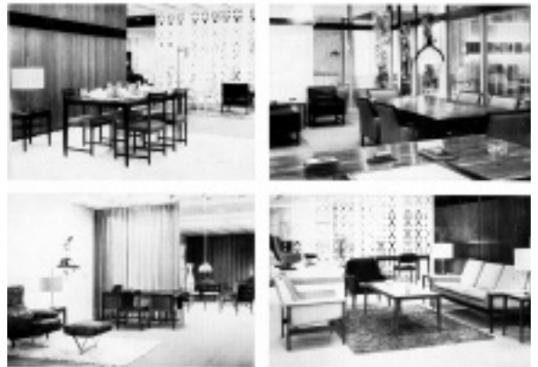
Toonkamer met geïmporteerd Scandinavisch meubilair. (part. coll.)

Dit tweetal ontwierp voor de Nederlandse fabrikant fauteuils waarbij de kuip rustte op een houten frame in een aantal variaties. De vering bestond uit zogenoemde 'zigzagvering' en als opvulmateriaal werd schuimrubber toegepast. Opmerkelijk is dat de ontwerpen van banken en fauteuils in de rug vrijwel allemaal van een naad zijn voorzien. Slechts het model 'Margit' is gecapitonneerd. De productie van dit Deense meubilair geschiedde volgens een licentieovereenkomst. In dit contract stonden zaken beschreven als duur van de overeenkomst (opzegtermijn), aansprakelijkheid, garanties en de vergoeding verbonden aan het gebruiksrecht. Het intellectuele eigendom bleef overigens bij de ontwerper berusten. De Hilversumse fabriek mikte op afzet in eigen land.