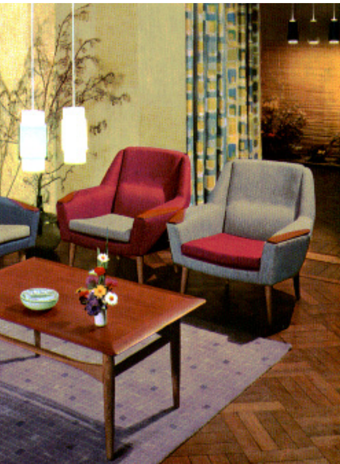
Bankstel 'Lone' naar ontwerp van Madsen & Schubbel. Salontafel 'Ebba' (100 x 70 cm). (part. coll.)