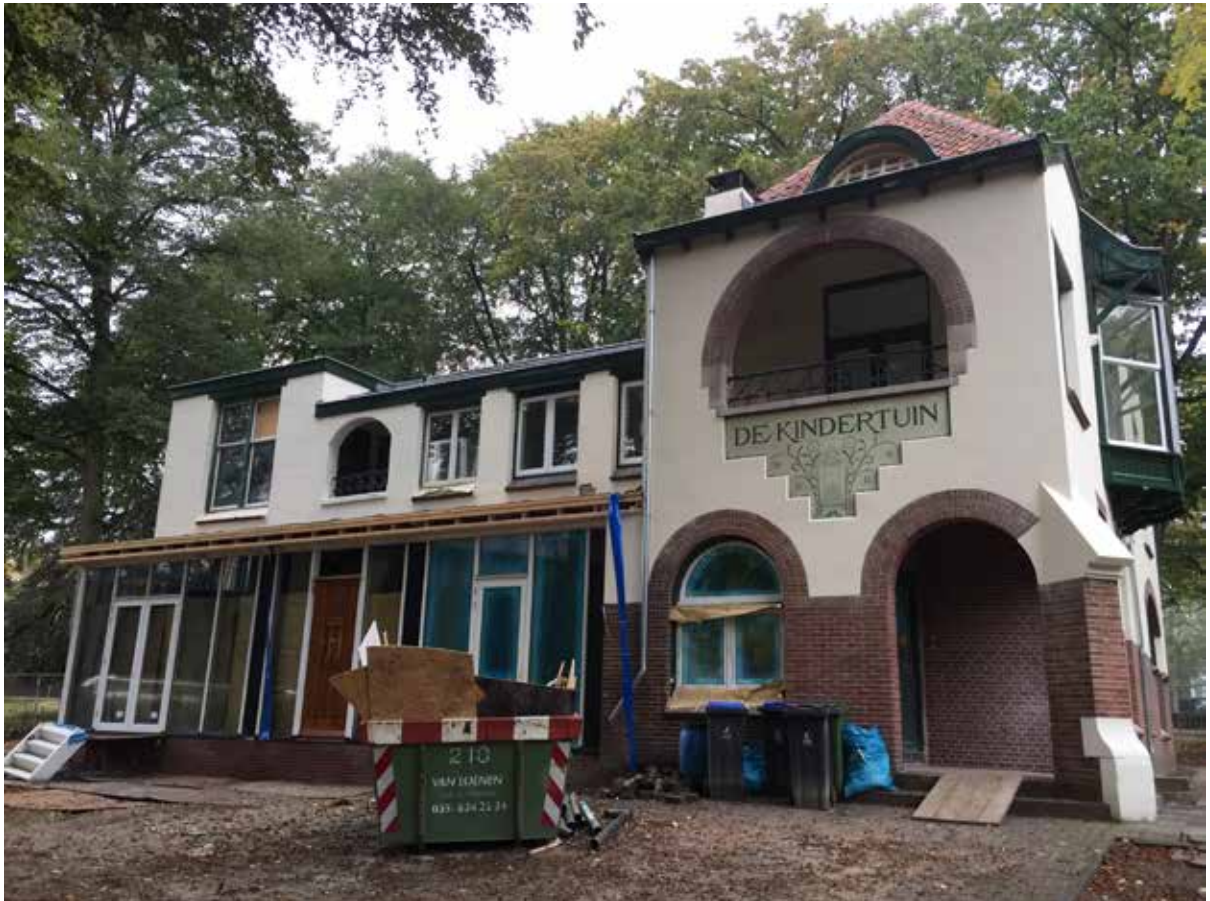
De villa tijdens de verbouwing in 2016.

handen. Ik heb het pand kort geleden mogen bezichtigen. Het zijn twee zelfstandige woningen onder een kap geworden, verbouwd, gerenoveerd en van alle moderne gemakken voorzien. Toen ik laatst bij de voordeur aanbelde, realiseerde ik mij dat het 79 jaar geleden was dat ik hier voor het laatst als kleuter door deze deur naar binnen was gegaan...”