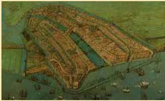
Mej. Boom kwam van goeden huize. Zo was voorouder Pieter Cornelisz Boom als burgemeester van Amsterdam in 1607 nauw betrokken bij de inpoldering van de Beemster. (Wikipedia)