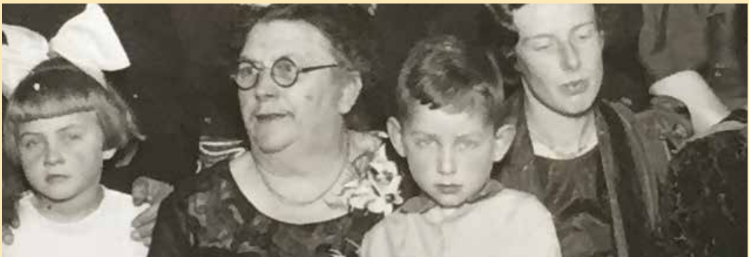
De directrice tijdens het veertigjarig jubileum van haar school.