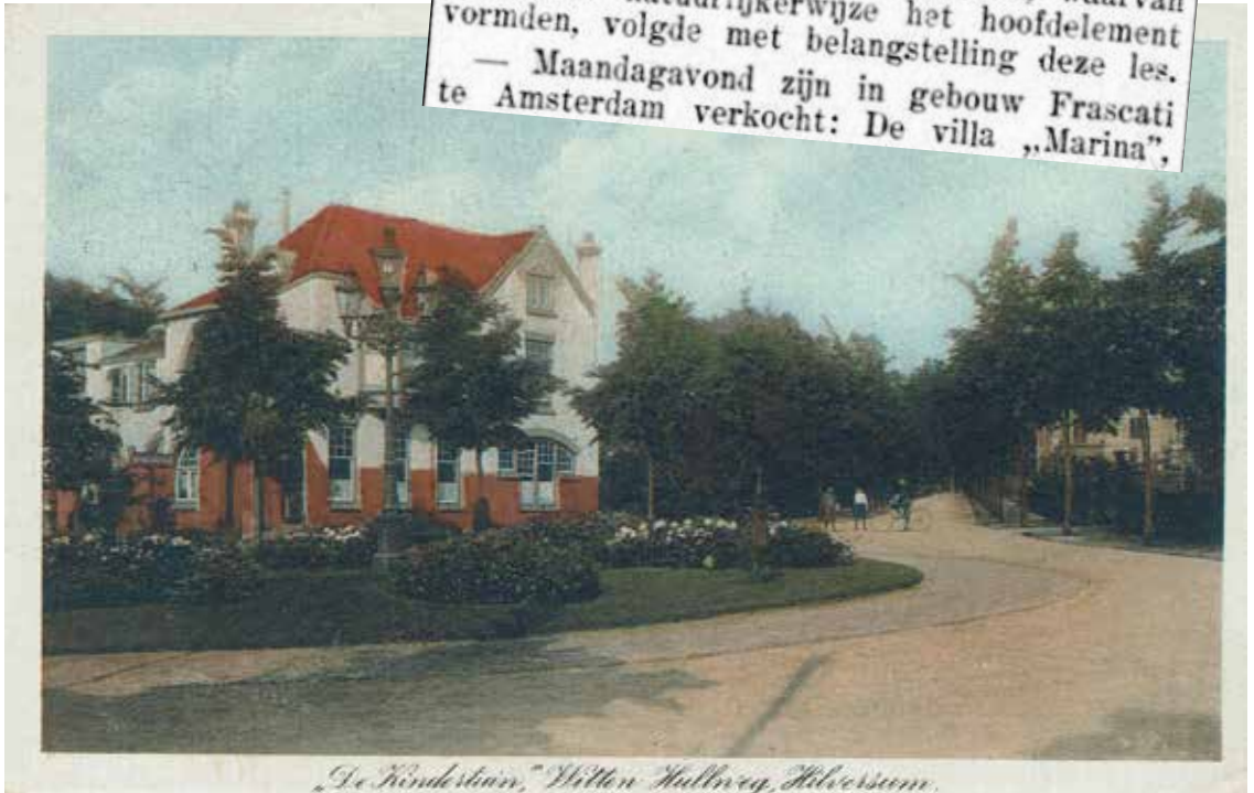
Ansichtkaart De Kindertuin uit 1909.