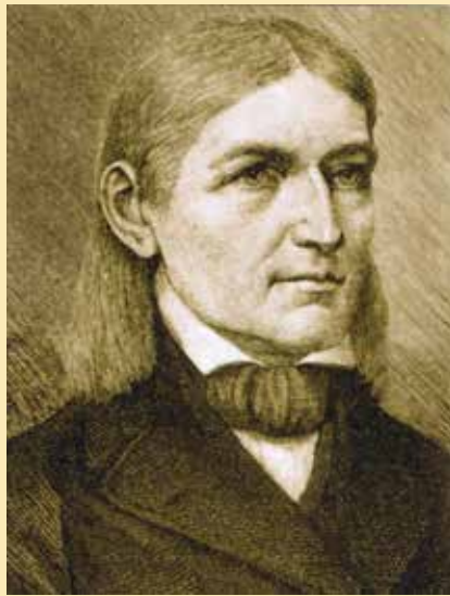
Friedrich Wilhelm Fröbel, bedenker van de methode 'spelend leren' die zijn naam draagt.