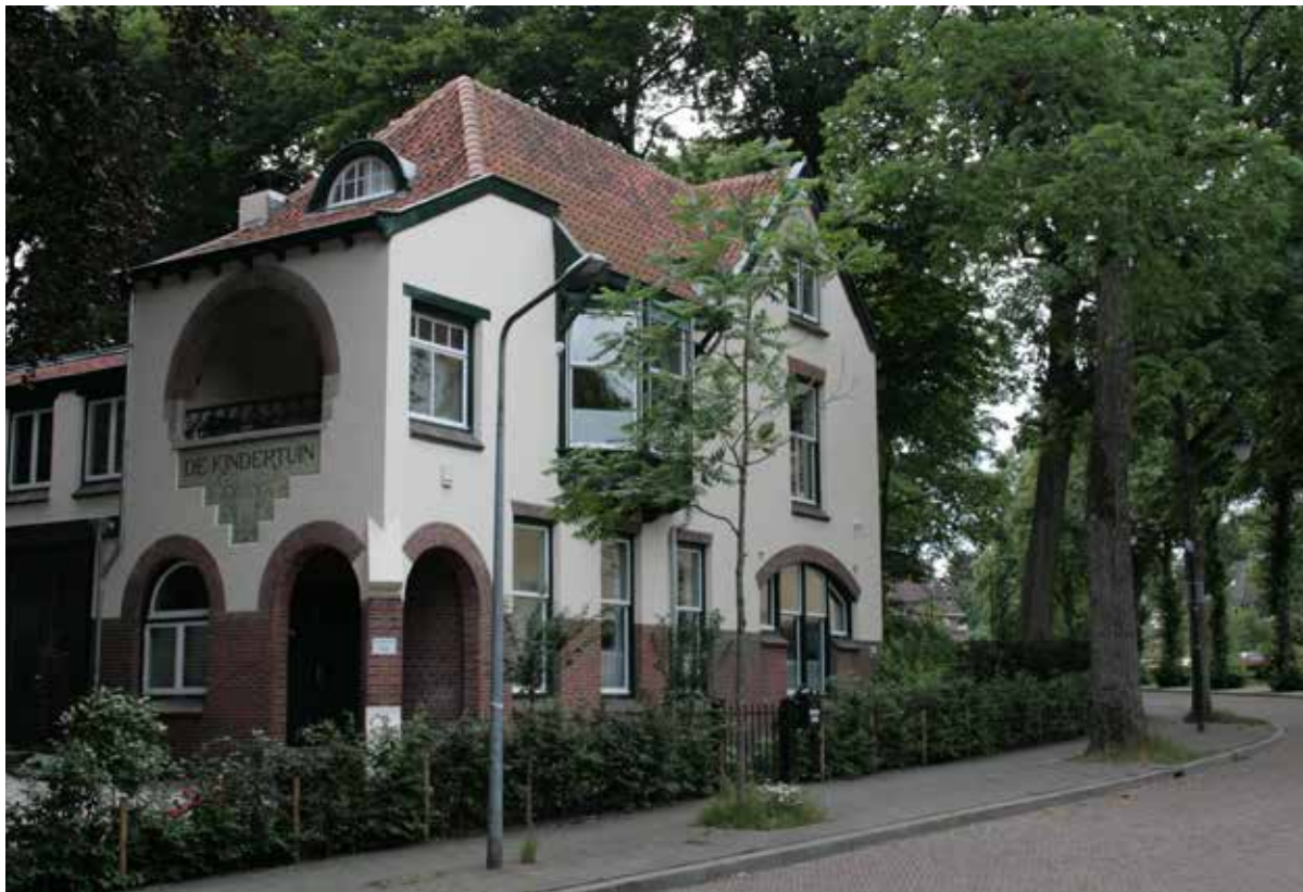
De Kindertuin in huidige staat. Het gebouw is gerenoveerd met oog voor historische details en opgesplitst in twee woningen.

standen . Er zouden er minstens drie bij moeten komen, aldus de bond. Eén school in de wijk Over het Spoor en twee in het centrum. 13 Daar zou het niet bij blijven, in de loop van de jaren twintig opende de gemeente steeds meer eigen fröbelscholen. Met als gevolg dat de klassen van de particuliere scholen, zoals De Kindertuin, allengs kleiner werden.