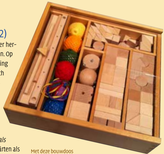
Met deze bouwdoos waarin bol, kubus en cilinder centraal staan, maakten de kleuters kennis met driedimensionale figuren. (Wikipedia)

Van Fröbels naam is het woord fröbelen afgeleid, dat zoveel betekent als "vrijblijvend creatief bezig zijn". In Nederland werd zeker tot in de jaren zestig van de 20e eeuw de term fröbelschool gebruikt om een kleuterschool aan te duiden. 20