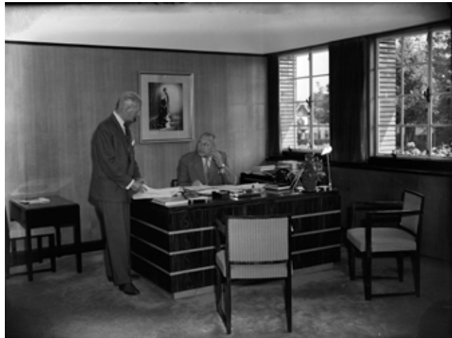
Boot achter zijn bureau in de burgemeesterskamer, 1957.