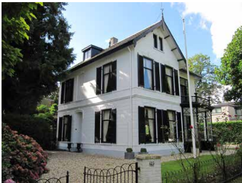
De voormalige burgemeesterswoning aan de Torenlaan 45 in Hilversum.