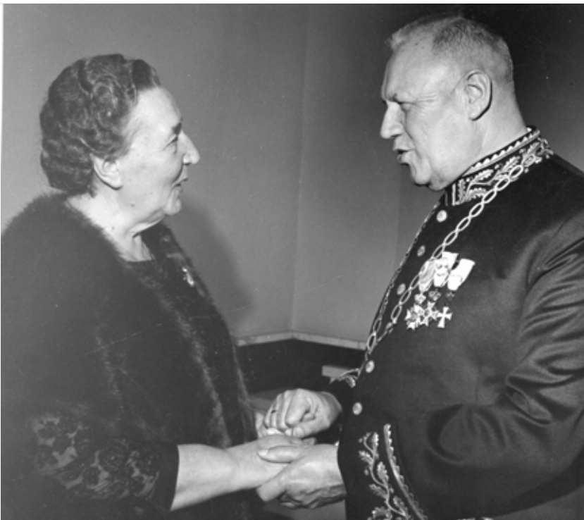
De heer en mevrouw Boot werden respectievelijk benoemd tot ridder in de Orde van de Nederlandse Leeuw en Ridder in de Orde van Oranje Nassau.

eigenschappen treden in de openbaarheid. Hij is nooit baas over zijn eigen tijd.