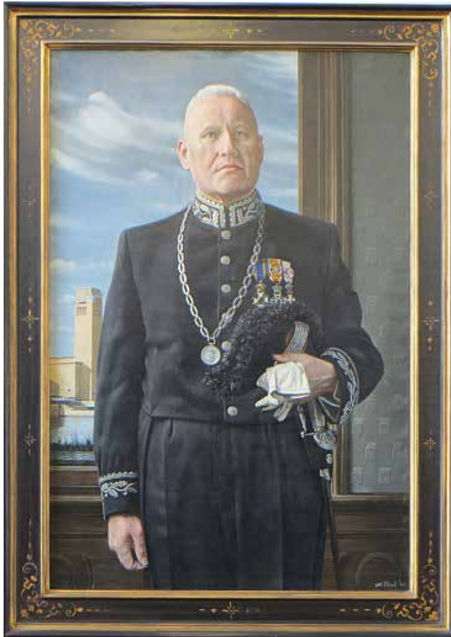
Portret door Carel Willink.

sultaat anders was dan hij had verwacht. Er zat helemaal geen humor in. Ik had gedacht dat ik er met een ietwat olijk trekje zou uitkomen, maar wat ik er van zie, zit er geen opgewektheid in. Ik ben een in een ambtskostuum gestoken staatsiefiguur, die weet dat hij burgemeester is, aubades in ontvangst neemt en parades afneemt, betreurde Boot, die wat ironisch afsloot. Ik geloof dat het door deskundigen wel geprezen word.