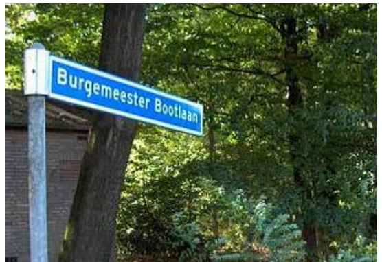
In Hilversum is geen straat of laan naar oud-burgemeester Boot genoemd, maar wel in Ede en Varsseveld. Dit is de Burgemeester Bootlaan in Ede.

Na het afscheid, eind december 1967, verhuisde het echtpaar Boot naar Bennekom. In 1971 overleed mevrouw Boot. Zes jaar later hertrouwde de oud-burgemeester met hoogleraar Berthe Siertsema. Hij overleed op 20 januari 2002 in Oudemirdum, op 99-jarige leeftijd.