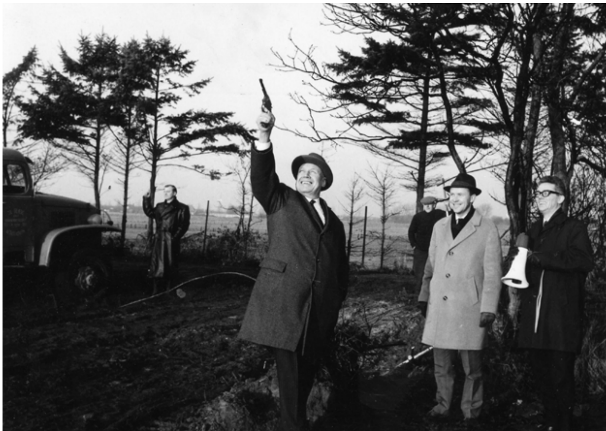
Het startschot voor het bouwrijp maken van de grond voor de nieuwe woonwijk Kerkelanden in 1966.

nieuwe parkeerterreinen - er op dat moment al waren. Als burgemeester zou hij de gesaneerde kern, een hoofdpunt van het gemeentelijke beleid, niet meer meemaken. Wat dat betreft ben ik als Mozes, ik zal het beloofde land wel aanschouwen, maar niet mogen binnentrekken. De Hilversumse binnenstad moet leefbaar blijven en zijn aantrekkingskracht voor de winkelstand houden, beklemtoonde Boot. 'Shopping-centres' aan de buitenkant waren uit den boze. Om het winkelhart bereikbaar te houden was gestart met de plaatsing van parkeermeters. Het invoeren van eenrichtingsverkeer zou pas na Boots afscheid zijn beslag krijgen.